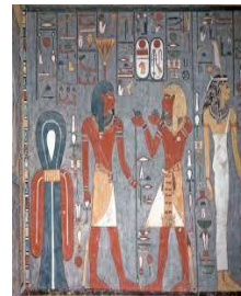
Amenofis dos frente al rey Osiris Tumba 58 del valle de los reyes. Tebas.

Para cada figura se utiliza un color especial según su significado e importancia, el azul turquesa se usaba al representar los dioses, rojo para los hombres, amarillo para las mujeres, verde para la vegetación, negro para objetos jeroglíficos y blanco para los ropajes.