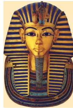
Máscara funeraria de Tutankhamon, elaborada en oro y descubierta en 1922

imperio (2800-2300 a. de C.), el nuevo imperio tebano (1580-1080 a. de C.), el bajo imperio en decadencia (644-342 a. de C.) y el período grecorromano (332-30 a. de C.)