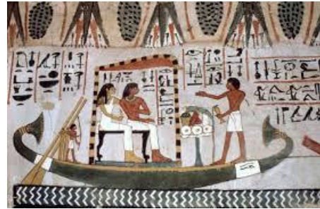
Detalle. Ida y vuelta de la peregrinación a Abydos de sennefer y su esposa.

En el interior de sus construcciones encontramos una amplia variedad de pinturas murales cuyos protagonistas son figuras humanas. Desarrollando sus labores cotidianas, acompañados de animales, en principio guiado por sus faraones; posteriormente narraban a través de su producción gráfica, su modo de vivir en relación con la naturaleza y casi siempre aparece la escritura jeroglífica presentada en forma de signo símbolos.