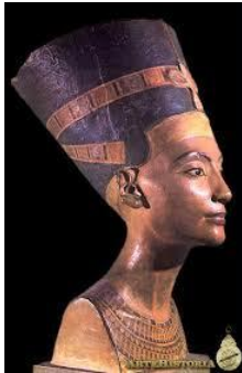
Cabeza de la reina Nefertiti Hallada en el taller de Tutnés (primer escultor del reino egipcio) en la capital de Tell-el-Amarna

Egipto es una de las civilizaciones más fascinantes de la historia de la humanidad. Hasta hoy, se conservan grandes y maravillosos monumentos construidos hace miles de años, como un reflejo de la gran sabiduría de estos pueblos que han dejado como herencia a las posteriores generaciones un invaluable tesoro, su legado artístico que aún vive en una arquitectura inimitable, perfecta en sus mediciones, totalmente sincronizada con lo científico y lo astrológico, una escultura sin igual en su dimensionalidad, y un aporte trascendental en el arte: la simetría y la asimetría fundamentales en la composición artística que de mil maneras mostraron al mundo en su particular pintura.