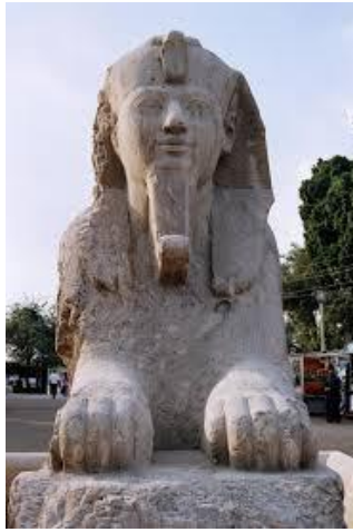
Esfinge de Ramsés II, Menfis.