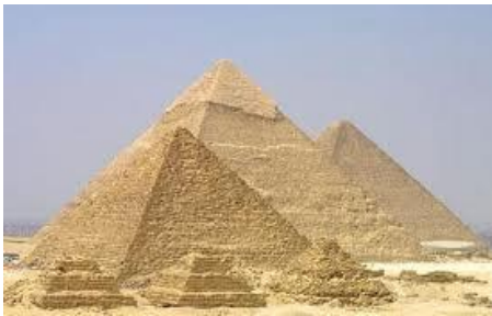
Pirámides de Keops, Kefrén y Micerino.