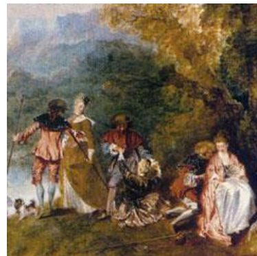
"L'embarquement pour Cythère". Wateau (Detalle) Uno de los cuadros más célebres del siglo XVII

Siendo Wateau uno de los grandes genios del último barroco francés y del primer rococó a quien se le atribuye la creación del género denominado como Rococó.