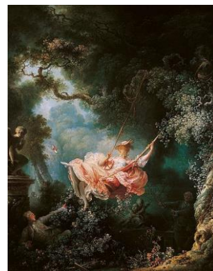
Los felices azares del columpio Jean Honoré Fragonard, 1767-1768

La arquitectura y la Escultura, abundaron las conchas, los amorcillos, las coronas y las flechas.