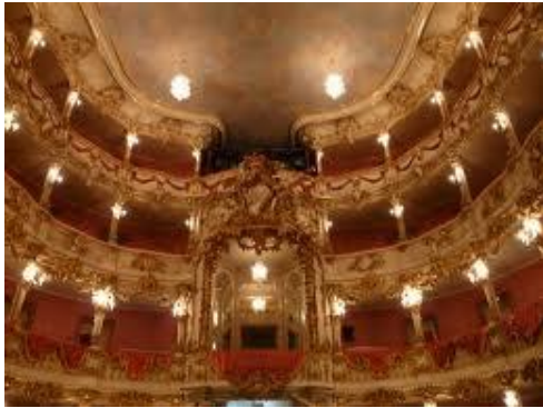
"Teatro de la Residencia de Munich". F. Cuvilliés, 1751 – 1753.