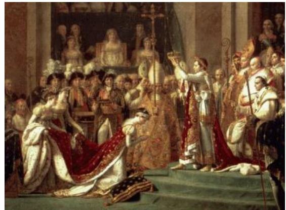
"La consagración de Napoleón y la coronación de Josefina" (1806). Jaques Luis David.

Se destacaron: Jaques-Louis David, Juan agosto Ingres y Francisco de Goya entre otros.