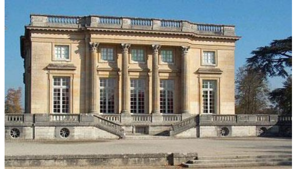
"Palacete Petit Trianon". J. A. Gabriel. Parque de Versalles.

Surge en esta época la llamada "Arquitectura Imperio, que consiste en la adaptación de elementos egipcios y de Pompeya, al estilo francés. Se realizaron obras como "El Arco del Triunfo de la estrella", "El Arco del Triunfo del Carrusel" y "Plaza Vendôme".