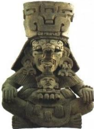
"Urna funeraria Zapoteca"

Una de las obras más conocidas de la cultura Zapoteca es el conjunto arquitectónico monumental del Monte Albán que es una ciudad sagrada conformada de pirámides, plataformas escalonadas y edificios que al parecer se levantaron con fines funerarios. En ello se observa el trabajo escultórico de esta cultura, en los relieves de las lozas de piedra que representan figuras deformes denominadas "Los Danzantes". También es importante el "Edificio J", que al parece era un observatorio astronómico.