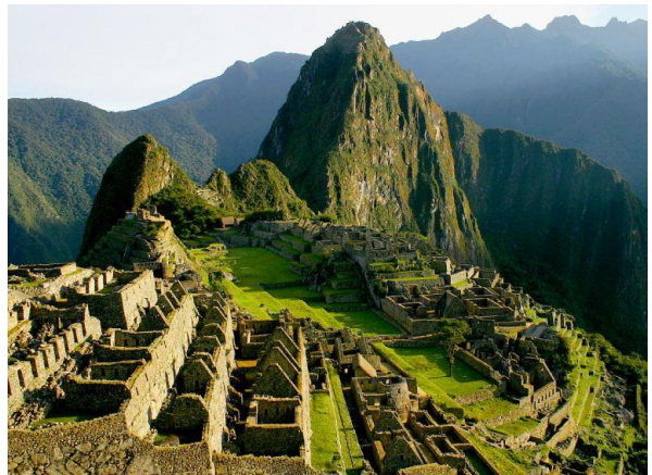
Vista general de Machu Pichu.

La leyenda cuenta que los hermanos Manco-Capac y Mama Ocllo fueron quienes fundaron este imperio en el Valle del Cuzco. Esta civilización comienza a finales del siglo XII y se desarrolla durante un siglo en el que se convierte en una de las civilizaciones más poderosas y mejor organizadas de América.