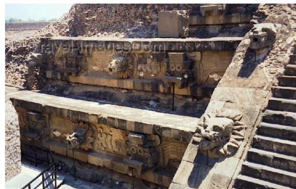
"Templo de Quetzalcóatl" (Lugar donde uno se convierte en dios).

Alcanza su mayor desarrollo durante el período clásico, cuando surgen las ciudades-estado construidas como centros políticos, administrativos y religiosos. El eje principal de la ciudad era la llamada "Calzada de los muertos" y en uno de sus extremos se distinguen la "Pirámide de la luna" y la "Pirámide del sol" y en el centro "La ciudadela". Además, se ubica en ésta construcción, el "Templo de Quetzalcóatl" en donde se observan las figuras escultóricas representando al dios que lleva el mismo nombre.