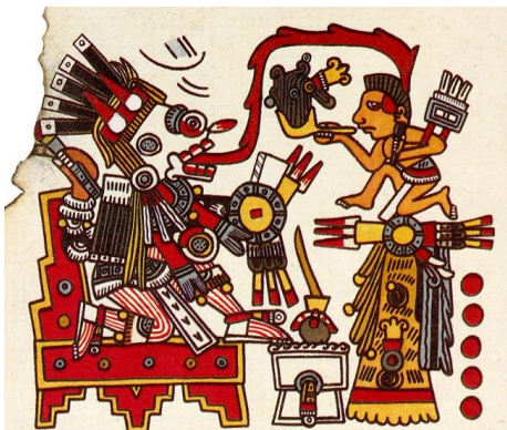
"Códex Borgia". Códice mixteca del siglo XIV-XVI.

lugar a lo que se llama Patrón Cultural Americano, ubicados en el área denominada "Mesoamérica", la cual se dividió en cuatro partes según las características que muestran los asentamientos de las diferentes culturas así: Suroeste mexicano (Cultura Maya), Golfo de México (culturas Olmeca, Huasteca y Totonaca), culturas del Altiplano Centrales (culturas Teotihuacana, Tolteca y Azteca), culturas de Oaxaca (Zapotecas y Mixtecas) y culturas de Occidente (Colima, Nayarit, Jalisco y Guerrero).