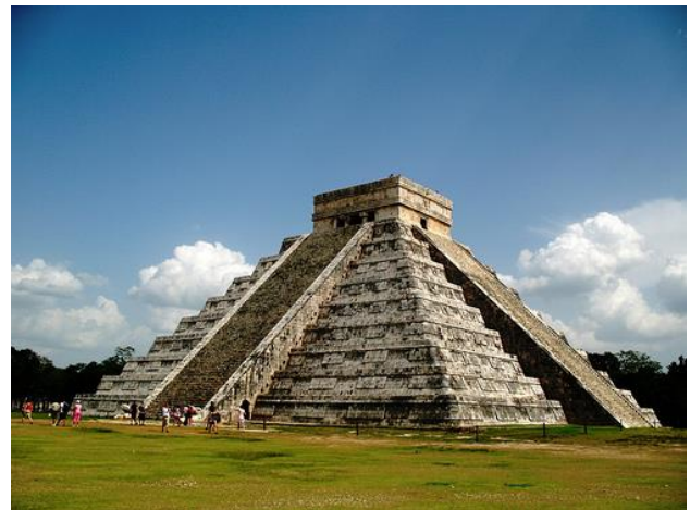
"El Castillo". Centro del grupo principal de las construcciones mayas-toltecas Chichén-Itzá.

En cuanto a la arquitectura, construyeron templos sobre pirámides escalonadas: Palenke, Tikal y Chichén Itzá.