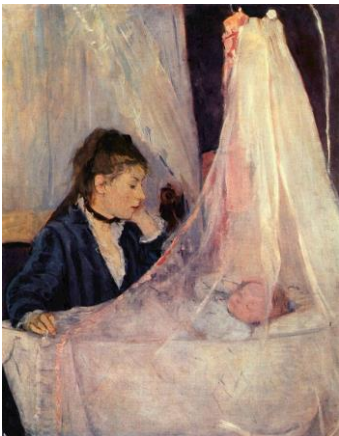
La cuna (1872)

Pronto adquirió la técnica impresionista de pintar al aire libre, donde creaba pequeños cuadros y esbozos para grandes obras que terminaba en el estudio. Su primera participación en el Salón de París fue en 1864 con dos paisajes y continuó exhibiendo continuamente en el Salón hasta 1874, año de la primera exposición impresionista, en la que participó con La cuna.