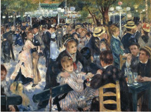
Baile en el Moulin de la Galette (1876)

Trató temas de flores, escenas dulces de niños y mujeres y sobre todo el desnudo femenino, que recuerda a Rubens por las formas gruesas.