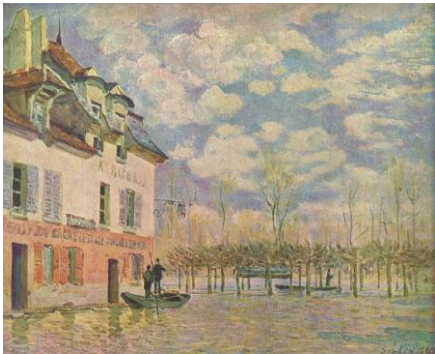
Inundación en Port-Marly, 1876

pobreza, antes de poder contemplar como sus cuadros, que en angustiosos momentos de penuria había vendido a precios irrisorios, al poco de su muerte comenzaban a ser apreciados por la crítica y el público y alcanzaban elevadas cotizaciones en el mercado artístico.