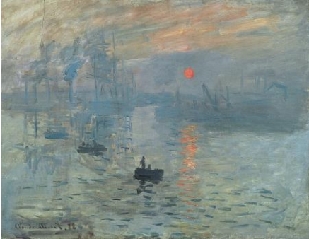
Impresión, sol levante, 1872.

Uno de los creadores del impresionismo. El término impresionismo deriva del título de su obra Impresión, sol levante (1872). Sus primeras obras, hasta la mitad de la década de 1860, son de estilo realista. Monet logró exponer algunas en el Salón de París. A partir del final de la década de 1860 comenzó a pintar obras impresionistas. En la década de 1870 formó parte de las exposiciones impresionistas y su obra “Impresión, sol levante” formó parte del Salón de los rechazados de 1874.