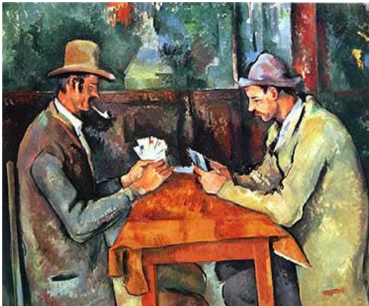
Los jugadores de cartas (1890)

Cézanne intentó conseguir una síntesis ideal de la representación naturalista, la expresión personal y el orden pictórico. Cézanne manifestó un interés progresivo en la representación de la vida contemporánea, pintando el mundo tal como se presentaba ante sus ojos, sin preocuparse de idealizaciones temáticas o afectación en el estilo. Luchó por desarrollar una observación auténtica del mundo visible a través del método más exacto de representarlo en pintura que podía encontrar. Con este fin, ordenaba estructuralmente todo lo que veía en formas simples y planos de color. Su afirmación «Quiero hacer del impresionismo algo sólido y perdurable como el arte de los museos».