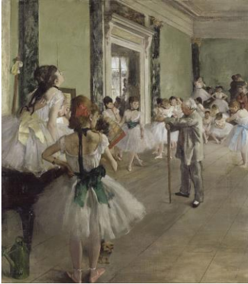
La clase de ballet, 1871-74

Considerado uno de los fundadores del Impresionismo, aunque él mismo rechazaba el nombre y prefería llamarlo realismo o arte realista, Degas fue uno de los grandes dibujantes de la historia por su magistral captación de la sensaciones de vida y movimiento, especialmente en sus obras de bailarinas, carreras de caballos y desnudos. Técnicamente, Degas difiere de los impresionistas ya que él “nunca adoptó la técnica de mancha y color”, y menospreciaba la práctica de la pintura al aire libre. Sin embargo, el tipo de arte de Degas se apega más al Impresionismo que a cualquier otro movimiento artístico. Sus escenas sobre la vida parisina, la composición y sus experimentos con el color y la forma; sin mencionar su cercanía con varios notables artistas impresionistas, relacionan indudablemente a Degas con el movimiento impresionista.