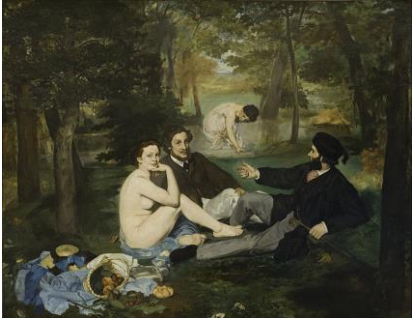
Desayuno sobre la hierba, 1863

Fue un pintor francés, reconocido por la influencia que ejerció sobre los iniciadores del impresionismo. Pese a que se le considera uno de los padres del Impresionismo, nunca fue un impresionista en el sentido estricto de la palabra. Por ejemplo, jamás expuso con el grupo y nunca dejó de acudir a los Salones oficiales, aunque le rechazaran. Afirmaba que «no tenía intención de acabar con los viejos métodos de pintura ni de crear otros nuevos». Sus objetivos no eran compatibles con los de los impresionistas, por mucho que se respetaran mutuamente.