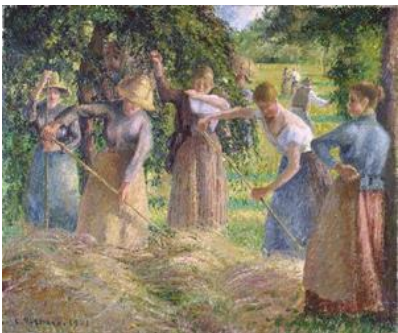
Cosecha de heno en Éragny, 1901

Pintó la vida rural francesa, sobre todo los paisajes y las escenas en los que aparecían campesinos trabajando, pero también escenas urbanas en Montmartre. Los cuadros de Pissarro captan de manera pura el estilo impresionista: profundidad, imagen construida con pinceladas visibles, uso de la vibración en el color y un prolijo estudio de la luz natural. Las pinturas de Pissarro son abiertas y claras, principalmente paisajes.