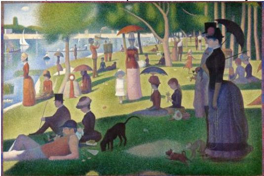
Tarde de domingo en la isla de la Grande Jatte (1884)

u pintura fuera rechazada por el Salón de París, Seurat se negó a presentarla en establecimientos como el Salón, aliándose con los artistas independientes de París. En 1884 conoció y estableció una amistad con su compañero artista Paul Signac. Seurat compartió sus nuevas ideas acerca del puntillismo con Signac, quien posteriormente pintó con la misma técnica. En el verano de 1885 Seurat comenzó la creación de su obra maestra Tarde de domingo en la isla de la Grande Jatte, que le llevó dos años completar. Su cuadro se expone en 1886 en la octava y última exposición de los impresionistas. Con este cuadro nace el término puntillismo, o técnica de la mezcla óptica de los colores. El 26 de agosto del mismo año se inaugura la exposición de los independientes, en ella se exponen diez obras suyas.