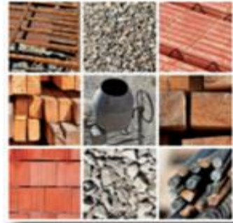
Materiales de construcción