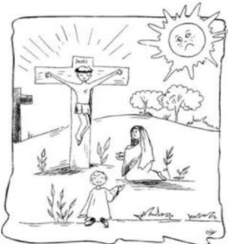
VIERNES SANTO: MUERTE DE JESUS