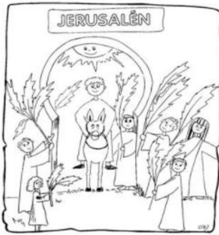
DOMINGO DE RAMOS