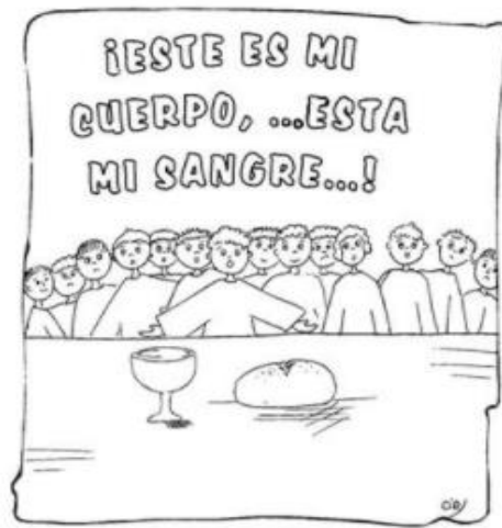
JUEVES SANTO: LA ULTIMA CENA