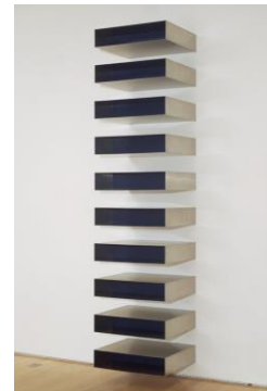
Donal Judd, sin titulo , 1969 - 1982

En la obra de Richard Serra, el equilibrio precario se vuelve más dramático, porque mientras en la anterior obra los objetos están fijados al suelo, en este caso las dos planchas de plomo de varias toneladas de peso están puestas una sobre la otra sin ninguna fijación, provocando una sensación de inestabilidad y peligro en el espectador.