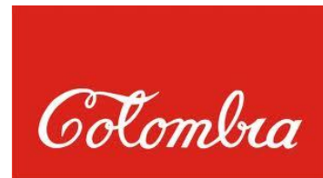
Antonio Caro, Colombia , 1978

El arte moderno en Colombia inspiró su trabajo en la autonomía de la obra de arte y una validación de lenguajes como la abstracción, los primeros artistas contradijeron los lenguajes clásicos de la pintura y la escultura y desarrollaron un arte de fuerte crítica social y cultural que abriría los caminos a las nuevas generaciones.