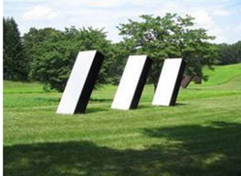
Charles Ronald Bladen, tres elementos , 1967

A continuación, se explicarán tres obras minimalistas y comentarlas brevemente para que te hagas una idea de lo que perseguían estos artistas: