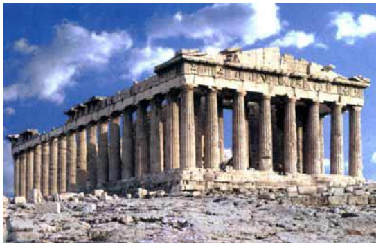
Partenón de Atenas en honor a la diosa Atenea

La arquitectura siempre estaba en perfecta armonía con la escultura, pues en los frisos y frontones de los templos siempre estaban presentes los altorrelieves en mármol. Las obras arquitectónicas más importantes construidas en esta época son el “ Partenón ” en honor a la diosa Atenea, el “ Erecteón ” dedicado a Erecto y la “ Atenea Niké ”