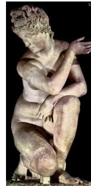
La afrodita agachada.