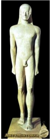
Kuros de Milos