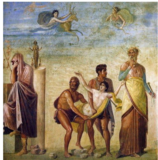
El sacrificio de Ifigenia. Museo Nacional de Nápoles

La cultura griega se expande por Asia menor y Egipto en campañas dirigidas por Alejandro Magno, lo que significó la fusión de la cultura griega con la oriental, dando como resultado el estilo artístico que llamamos helenístico.