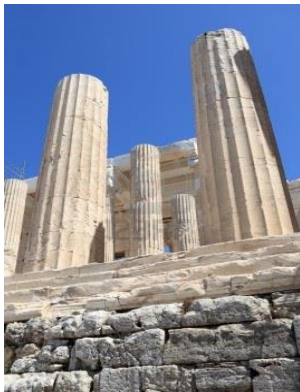
Columnas de los Propileos de la Acrópolis de Atenas.

Los griegos también construyeron otros edificios civiles como los teatros en donde se originaron las comedias y las tragedias y los odeones en donde se realizaban audiciones musicales.