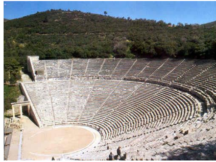
Teatro de Epidauro, arquitectura helenística de perfectas dimensiones.

ciudadanos griegos, este era un espacio abierto para todos.