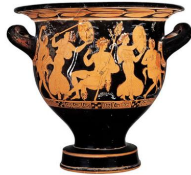
Dioniso, Ménades y Sátiros. Ánfora griega de figuras negras

La pintura estuvo estrechamente relacionada a la cerámica con dibujos en negro sobre fondo rojo y a medida que pasaba el tiempo, los pintores, se hacían más expertos y manejaban con mayor precisión las luces y sombras, el color y la composición. Así, la cerámica se convirtió en el principal punto de partida para los grandes pintores griegos: Polígnoto, Apolodoro, Zeuxis y Parracio.