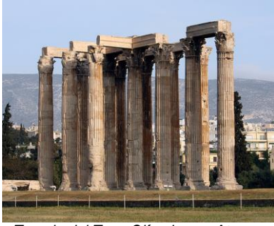
Templo del Zeus Olímpico en Atenas.

La arquitectura siempre estaba en perfecta armonía con la escultura, pues en los frisos y frontones de los templos siempre estaban presentes los altorrelieves en mármol. Las obras arquitectónicas más importantes construidas en esta época son el “ Partenón ” en honor a la diosa Atenea, el “ Erecteón ” dedicado a Erecto y la “ Atenea Niké ”