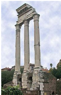
El templo de Cástor y Pólux. Agrigento, Sicilia

Los dioses son representados como seres humanos incluso en sus defectos y en sus vicios: Zeus, Hera, Apolo, Atenea, Afrodita y Poseidón.