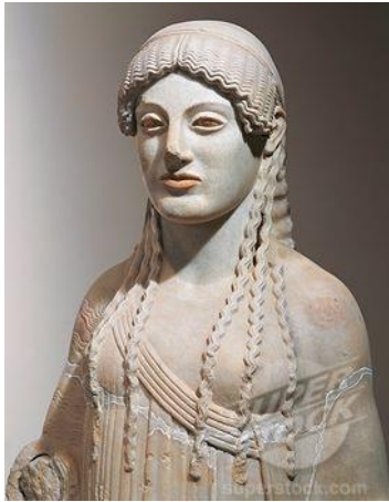
Koré de Eutídeos

Policleto del siglo V, es quien logra establecer los cánones de la figura humana, como el modelo de perfección representado a través del “ Doriforo ” y el “ Diadúmeno ”