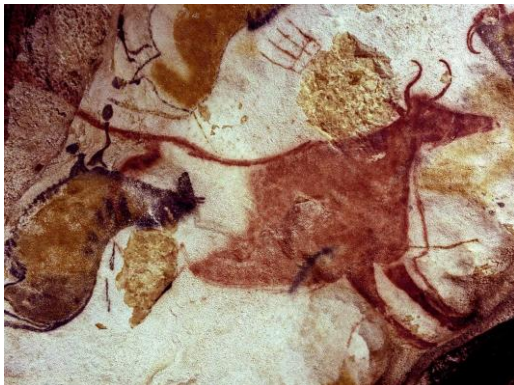
Un caballero y tres vacas que aparece pintados en el techo de la cueva de Lascaux

La tierra se formó hace aproximadamente 5000 millones de años atrás, en ella comenzó una evolución de especies vivas que dieron origen al hombre primitivo, nuestro más lejano antepasado, que habitaba en las cavernas cuyas paredes nos revelan las primeras manifestaciones artísticas, imágenes de formas tan simples, llenas de magia y de historias que nos harían maravillarse y contemplar la riqueza del arte a través de los tiempos.