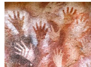
Cueva de las manos, con un grabado de manos de hace unos 9000 años. Santa Cruz, Argentina.

Sobre el significado del arte del Paleolítico se han formulado varias teorías. Una de ellas dice que estas pinturas tenían un fin mágico que influenciaba su vida real; así por ejemplo, la pintura de un bisonte, convocaría la caza del animal. Otra teoría nos habla de la magia de la fertilidad. La representación de los animales garantizaría su reproducción y por consiguiente la provisión de alimentos en el futuro.