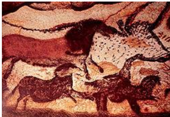
Fragmento de las pinturas rupestres de las cuevas de Lascaux en Dordoña, Francia. Representa en su orden: un caballo, un toro y un reno, composición extraordinaria denominada "Rotonda de los toros"

La temática fundamental del arte Rupestre, es la representación de animales y hombres. Los animales más comúnmente representados eran el caballo y el bisonte, también otras especies como el mamut, el ciervo, peces y pájaros.