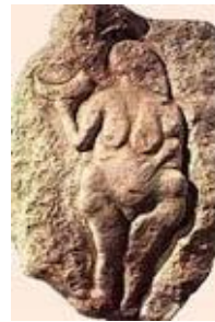
“Venus con el cuerno”. Laussel, Dordoña. 43 cm.

frecuente la elaboración de bajorrelieves con grandes cantidades de arcilla.