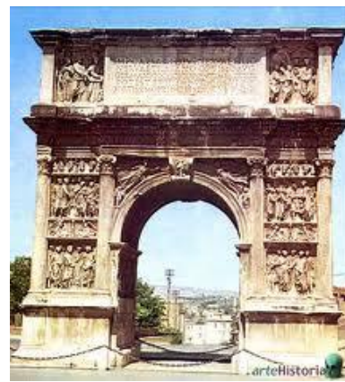
El arco de Trajano en Benevento

Un ejemplo de ellos es la “Columna de Trajano” y los arcos de Tito, Constantino y Trajano.