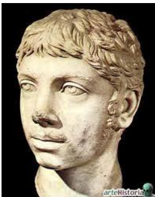
"Retrato del emperador Heligábalo" Museo capitolino, Roma

La escultura aunque fue en gran parte imitación, se destacó por los retratos y bustos principalmente de emperadores y familiares que no buscaban resaltar una belleza ideal sino por el contrario, intentaban acercarse al máximo a la realidad sin importar disimular la fealdad de los personajes, para ellos la belleza carecía de importancia, pero en cambio la exactitud era un factor esencial en las obras.