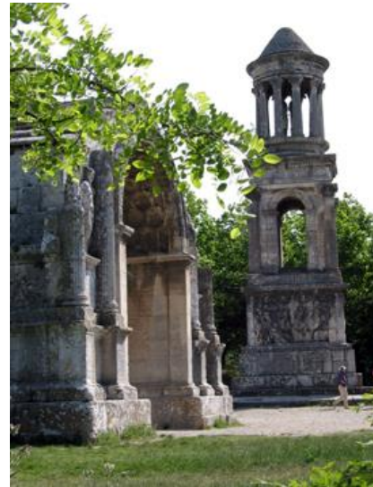
"Mausoleo de los Julios" Saint-Remy de Provenza.

Las columnas y frontones fueron adoptados del griego y los arcos y bóvedas del etrusco. Su originalidad consistió en el descubrimiento del hormigón o concreto en las construcciones.