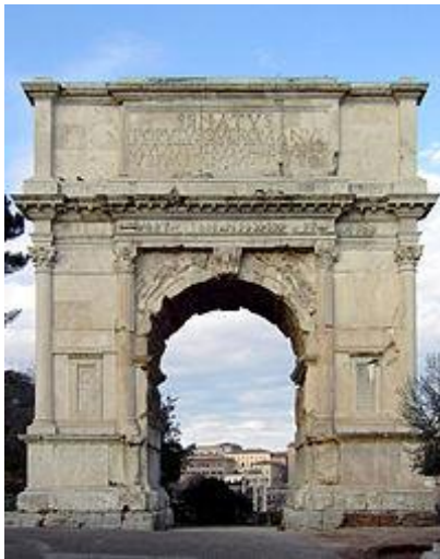
"Arco de Tito"

Los arcos de triunfo levantados en todas las partes del imperio se destacan como algunos de los monumentos más importantes.