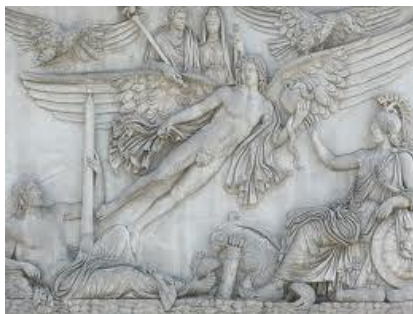
Relieve funerario "Apoteosis de Antonio Pio y su esposa Faustina" Museo Vaticano.

Los encargos privados de esculturas se hicieron por lo general en contextos funerarios.