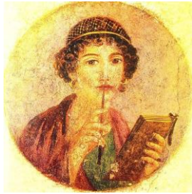
Retrato "Poetisa de la casa de Libanio" Museo de Nápoles.

fueron descubiertas, están realizadas con la técnica de la encáustica.