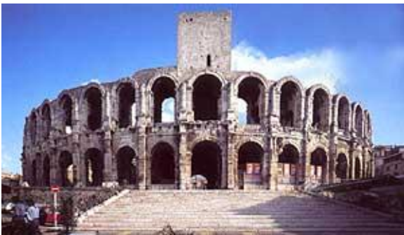
Anfiteatro de Arles

La piedra elegida variaba desde la toba y el travertino del centro de Italia, al brillante mármol blanco importado de Grecia y Asia Menor, en tiempos de Julio César.