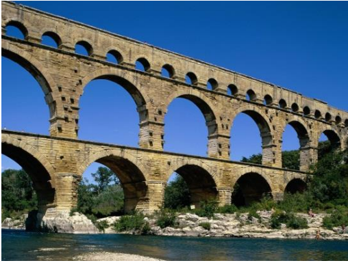
"Pont-du-Gard" sobre el río Gardon. Es acueducto y puente al mismo tiempo

El principal material de construcción romano a partir del período republicano, fue el sillar de piedra de cantería local, utilizado junto con vigas de madera, tejas y baldosas cerámicas.