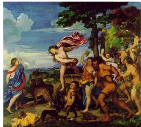
"El triunfo de Baco y Ariadna". Tiziano, 1518.

y el dinamismo de la línea. En ella, la forma no hace parte de la estructura sino que aparece como decoración, ahora lo que importa es el contenido, por eso la pintura de este entonces requería una explicación para ser comprendida.