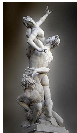
"Rapto de las Sabinas". Gianbologna, 1583

Las primeras academias de pintura son fundadas durante el periodo manierista. En ellas lo más importante eran las reglas que venían del clasicismo.