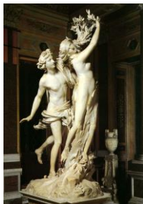
"Apolo y Dafne". Bernini 1622-1625.

La arquitectura otorga especial importancia a los valores tonales y al dibujo, volviéndose bastante pictórica. Reemplaza lo lineal del Renacimiento por el movimiento en formas que parecen avanzar y retroceder. Lo más común es esa inclinación hacia lo nuevo, lo raro, buscando la aplicación de artificios y mostrando lo ostentoso