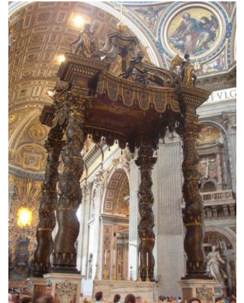
Baldaqino en bronce realizado por Bernini para San Pedro de Roma, 1624 – 1633

Uno de los escultores más destacados de la época es Juan Lorenzo Bernini.