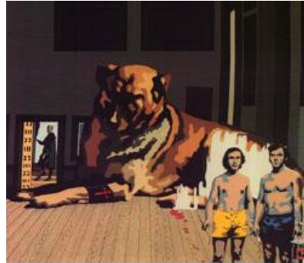
Equipo Crónica El Perro 1970

Además este cuadro es un emblema de la pintura española, porque aparece retratado el pintor cumbre de nuestro siglo de oro con la familia real, esto ofrece también tema de trabajo para pintores más críticos con el sistema político español en la época de Franco como fueron el Equipo Crónica.