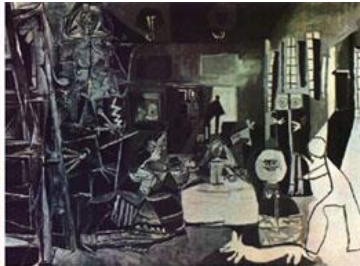
Picasso, las Meninas basadas en Velazquez 1957

Las representaciones de Picasso están marcadas por su estilo personal, utiliza fundamentalmente gamas de grises, blanco y negro para definir la forma de las figuras sobre las que a veces da un toque de color.