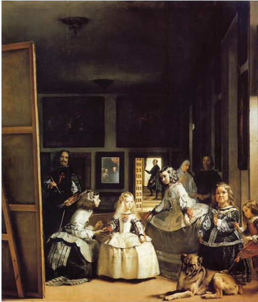
“Las meninas”. Velázquez , 1656

Sobre el cuadro de las Meninas de Velázquez existen numerosas versiones, Picasso hizo muchas de ellas en los años 50: de toda la composición y de algunas figuras por separado.