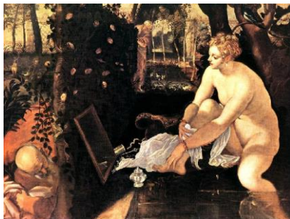
"Susana en el baño" Tintoretto

Así el manierismo se convirtió en el reflejo y expresión de la actitud atormentada en una época llena de cambios políticos e ideológicos producto de la reforma y contrarreforma.