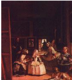
Velazquez, las Meninas 1660

Sobre el cuadro de las Meninas de Velázquez existen numerosas versiones, Picasso hizo muchas de ellas en los años 50: de toda la composición y de algunas figuras por separado.