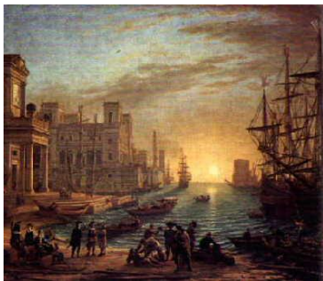
"Puesta de sol en un puerto". Claude Gellé (Le Lorain) llamado Claudio Lorena en España

Aún no se conoce con precisión del término "Barroco", algunas teorías afirman que proviene del portugués Barrueco que significa perla irregular, pero todos opinan que su origen es italiano. En cualquier caso, este término, se utilizó principalmente para calificar de una manera despectiva un arte de mal gusto, que se oponía a lo clásico, al equilibrio de las formas y a la disposición de los elementos en el plano compositivo.