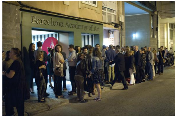
Inauguración de la Barcelona Academy of Art

Sí, mira, hacemos un concurso de arte figurativo que ya va por su 7a edición en el que más del 60% de los participantes no son españoles. Esto significa que estamos creando una gran corriente internacional. Es un proyecto muy potente: tenemos una fundación, hemos abierto un museo, hay un concurso internacional, el año pasado abrimos una academia: la Barcelona Academy of Arts, que es la primera vez en España que una academia enseña pintura y dibujo con los cánones del siglo XVIII, con los modelos y las formas de trabajar de esa época, y que está vinculada a las otras cuatro únicas academias de este tipo que hay en todo el mundo: Florencia, Nueva York, Toronto y Los Ángeles. Tenemos otros proyectos en marcha de abrimos a exposiciones itinerantes en museos europeos.