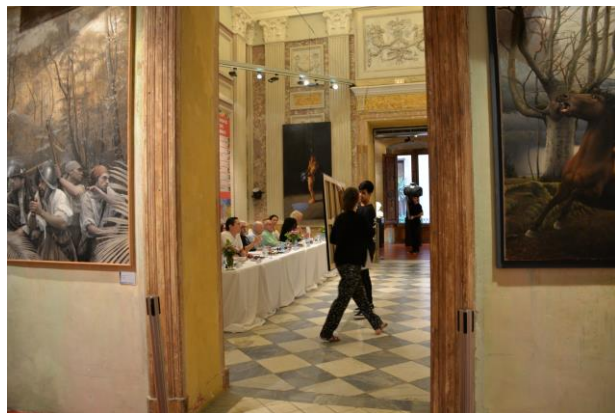
Obras de Mikel Olazábal en el MEAM.