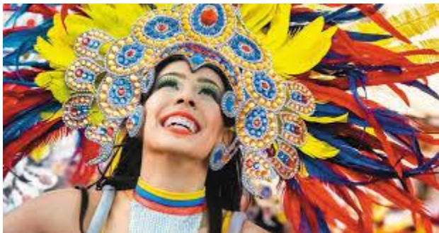
Carnaval y tradición