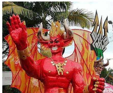
Carnaval de Riosucio