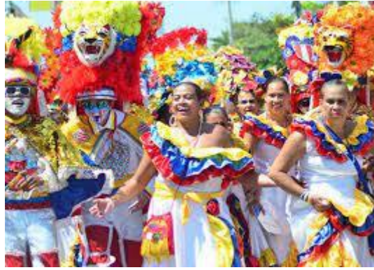
Carnaval, desahogo, euforia...