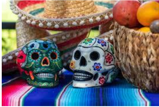
Fiesta de los muertos... México