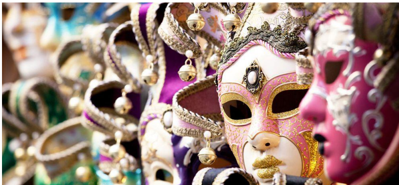
Carnaval y clases sociales