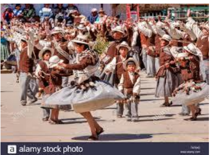
El carnaval y los ciclos de la vida