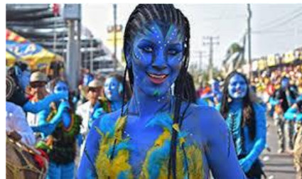
Carnaval y mestizaje