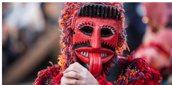
Carnaval y sátira