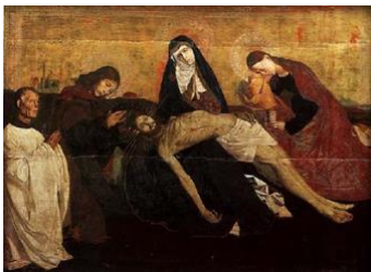
la piedad de Villeneuve-les-Avignon. Museo de Louvre. Siglo XV.

La pintura en cambio, se remite en su mayoría a vitrales, códices y retablos en su etapa inicial, posteriormente las miniaturas y vidrieras y a finales del siglo XIV surge el “Estilo Gótico Internacional” cuyas principales características son el colorido, su fuerte naturalismo, la tendencia caricaturesca y la aparición de la figura del mecenas .