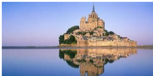
Mont-Saint-Michael. Islote normando

El arte de estilo gótico se remonta a la época medieval, allí abundaban los recintos monásticos claustros , capillas, basílicas e iglesias, donde el trabajo de los arquitectos se sucedía uno tras otro, respetando la ejecución del plano original.