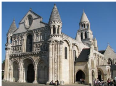
Notre-Dame la Grande de Poitiers, 1143

El arte románico abarca la producción artística de los países de Europa occidental durante los siglos XI y XII. Así como Roma se inspiró en el arte de los griegos, el románico toma elementos del romano. En el arte Románico, se pretende que la escultura, la pintura y la arquitectura sean una sola. En esta época las construcciones predominantes fueron las iglesias y monasterios , con columnas adornadas en sus capiteles por relieves de figuras humanas, animales o motivos decorados con hojas y muros repletos de pinturas al fresco , vidrieras y vitrales .