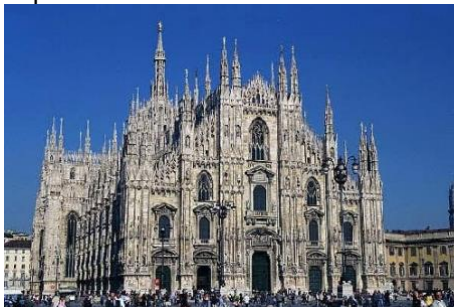
catedral de Milán Único templo italiano enteramente gótico.

El gótico español fue en todo el resto de Europa, de importación francesa, asimilando con fidelidad los parámetros básicos para la preservación del estilo en todo su esplendor.