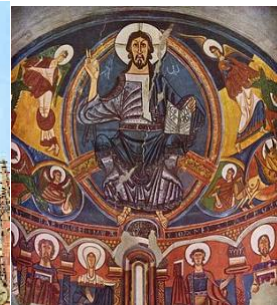
San Clemente de Tahull Pintura Románica hispánica