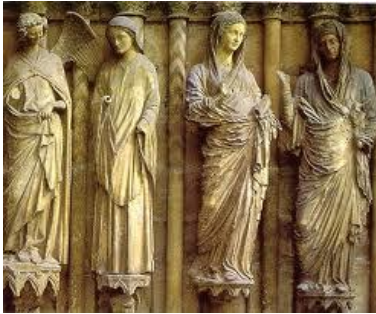
Figuras esculpidas en la fachada de la Catedral de Reims.

La escultura gótica (finales del siglo XIII) en el norte de Francia se caracterizó por la búsqueda del naturalismo y la humanización del mundo divino. Está totalmente subordinada a la arquitectura y es creada prácticamente en función de ella.