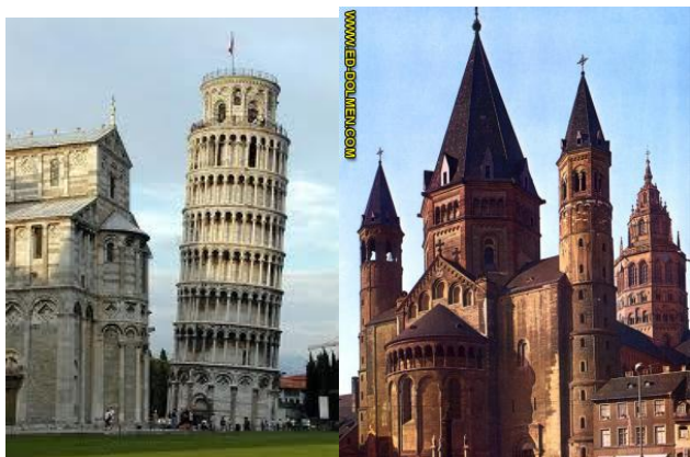
Catedral de Pisa y campanario o Torre inclinada. (Debe su inclinación al movimiento del terreno en que se asienta) Catedral de Maguncia. Románico alemán.

La arquitectura suntuosa , influenciada por alemanes lombardos , representada en la construcción de catedrales y basílicas , presenta una amplia variedad de estilos combinados, en las cuales se puede apreciar el empleo de columnatas griegas, adornos de origen mesopotámico, arcos romanos y la decoración interna compuesta de mosaicos y frescos alusivos a temas religiosos políticos.