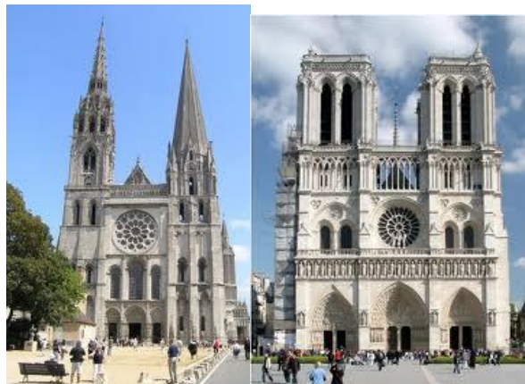
Catedral de Chartres, la más clásica del gótico francés Catedral de Notre Dame Paris (1200-1240)

El carácter esencial de la construcción gótica está en el empleo de un tipo especial de bóveda en ojiva, reconocido como estilo ojival.