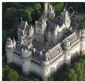
Castillo de Pierrefonds, Francia

Los castillos construidos bajo una rigurosa concepción geométrica y una notable sobriedad, difieren del afán pintoresco del romanticismo.