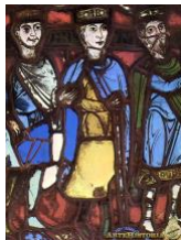
"Los reyes magos" Vital de Saint Denis, Siglo XII

Los orígenes del arte románico y del periodo medieval se remontan al año 500 a. C., bajo el dominio de los pueblos celtas , representado en la expresión de grafismos y simbolismo abstracto. Con el surgimiento de nuevos pueblos nómadas de origen asiático se establece el tipo de arte completamente medieval conocido como arte Bárbaro.