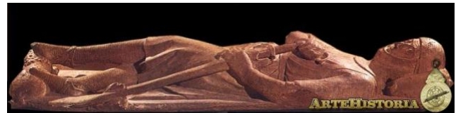
Estatua yacente de un caballero, Iglesia San Juan Bautista De Danbury en Inglaterra

Alemania recibió un estilo ya formado, en contradicción con la errónea creencia de su autoría, el gótico se extendió por toda Europa, Inglaterra y el oriente latino, donde se fue paulatinamente extinguiendo, dando pasos a nuevos estilos.