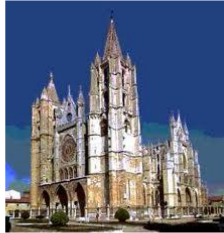
Catedral de Burgos, Una de las máximas realizaciones del gótico hispano

A pesar de la resistencia por adoptar el estilo, Italia representa las características del gótico en formas accesorias. El único templo enteramente gótico en la catedral de Milán, monumental construcción concluida sólo hasta entrado el siglo XIX.