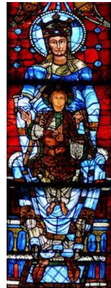
Notre.Dame a la Belle Verriere, Vitral de Chartre

El vitral es considerado como la auténtica pintura románica francesa. El color adquiere vitalidad gracias a la luz que atraviesa los ventanales al interior de las catedrales .