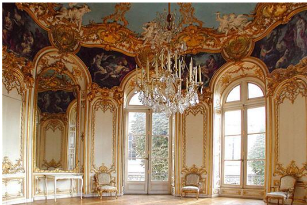
"Salón Oval del Hotel de Soubise". Paris. G. Boffrad

El estilo Rococó surge a mediados del siglo XVIII en Francia como una renovación del Barroco. El término se hizo famoso gracias a un grabador quien lo tomó como una forma de burla a las formas del estilo de Luis XV y se caracterizó por ser un arte de la aristocracia y la burguesía dado entre lo barroco y lo romántico de una manera elegante y agradable.