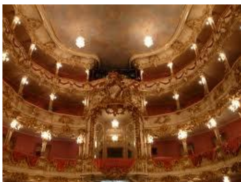
“Teatro de la Residencia de Munich”. F. Cuvilliés, 1751 – 1753.