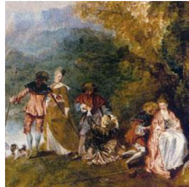
"L'embarquement pour Cythère". Wateau (Detalle) Uno de los cuadros más célebres del siglo XVII

Siendo Wateau uno de los grandes genios del último barroco francés y del primer rococó a quien se le atribuye la creación del género denominado como Rococó.