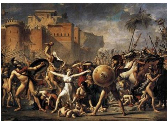
“Las sabinas interponiéndose entre romanos y sabinos” J. L. David. Uno de los cuadros más célebres del siglo XVIII

De esta manera, el Neoclasicismo surge como reacción antirococó volviendo a la antigüedad Grecorromana y al Renacimiento.