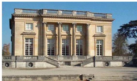
“Palacete Petit Trianon”. J. A. Gabriel. Parque de Versailles.

Surge en esta época la llamada “Arquitectura Imperio, que consiste en la adaptación de elementos egipcios y de Pompeya, al estilo francés. Se realizaron obras como “El Arco del Triunfo de la estrella”, “El Arco del Triunfo del Carrusel” y “Plaza Vendôme”.