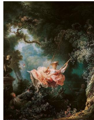
Los felices azares del columpio Jean Honoré Fragonard, 1767-1768

La arquitectura y la Escultura, abundaron las conchas, los amorcillos, las coronas y las flechas. Principalmente en países como Alemania, el Rococó llegó al máximo de recargamiento, siendo famosos: La Residencia y Teatro de Munich, El Monasterio Benedictino de Ottobeuren, la Residencia de Wurzburg entre otros.