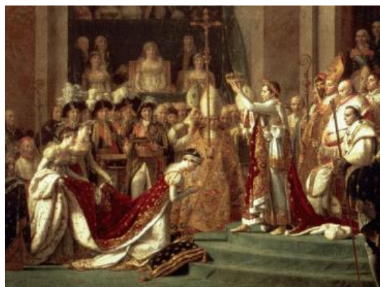
“La consagración de Napoleón y la coronación de Josefina” (1806). Jaques Luis David.

Se destacaron: Jaques-Louis David, Juan agosto Ingres y Francisco de Goya entre otros.