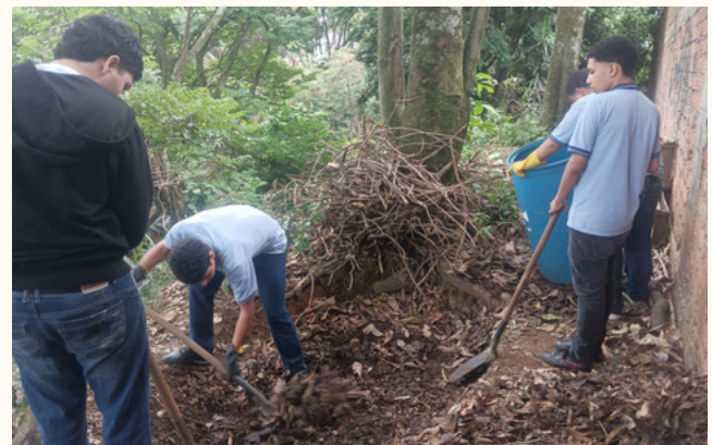
Estudiantes realizando el proceso de limpieza en la compostera

Este proceso de compostaje no solo ayuda a estos jóvenes a realizar procesos de aprendizaje y cuidado del medio ambiente, sino sobre el aprovechamiento de residuos orgánicos, además, que sirve como fuente de recursos para que otros espacios de construcción social, como la huerta escolar, sea autosostenible, es decir, que genere sus propios recursos.