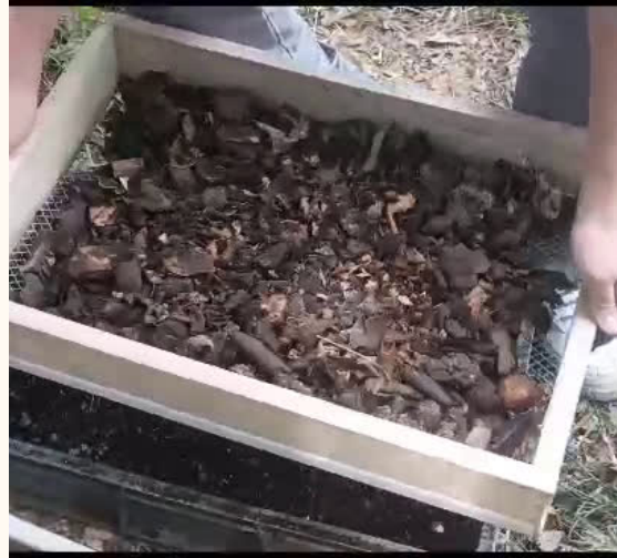
Estudiantes realizando el proceso de tamizaje

En este proceso, se ha involucrado toda la comunidad educativa, permitiendo que el espacio sea un lugar común para el encuentro con los demás.