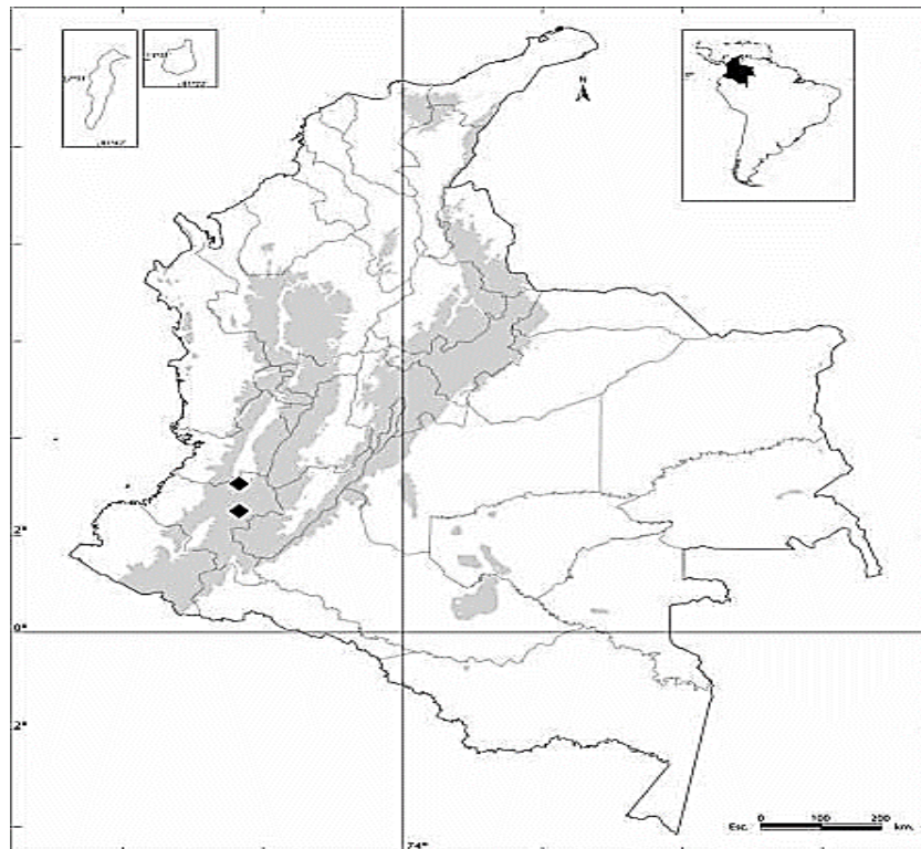
Figura 10. ... Distribución geográfica de Wirococcia rimbensis E. Ortiz en Colombia.

Está conformado principalmente, por las cordilleras de los Andes y por los sistemas montañosos, así: