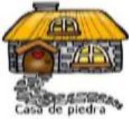
Casa de piedra