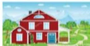
Casa campestre ó Chalet

https://1.bp.blogspot.com/-BRntV1m3_C4/YFfpwc6Rrel/AAAAAAAAEj0/veqzkrfFgzka6v2MvKoJnCovx0vZI5KPwCLcBGAsYHQ/s1006/tipos+de+vivienda.png