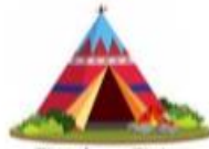
Tienda o Tipi