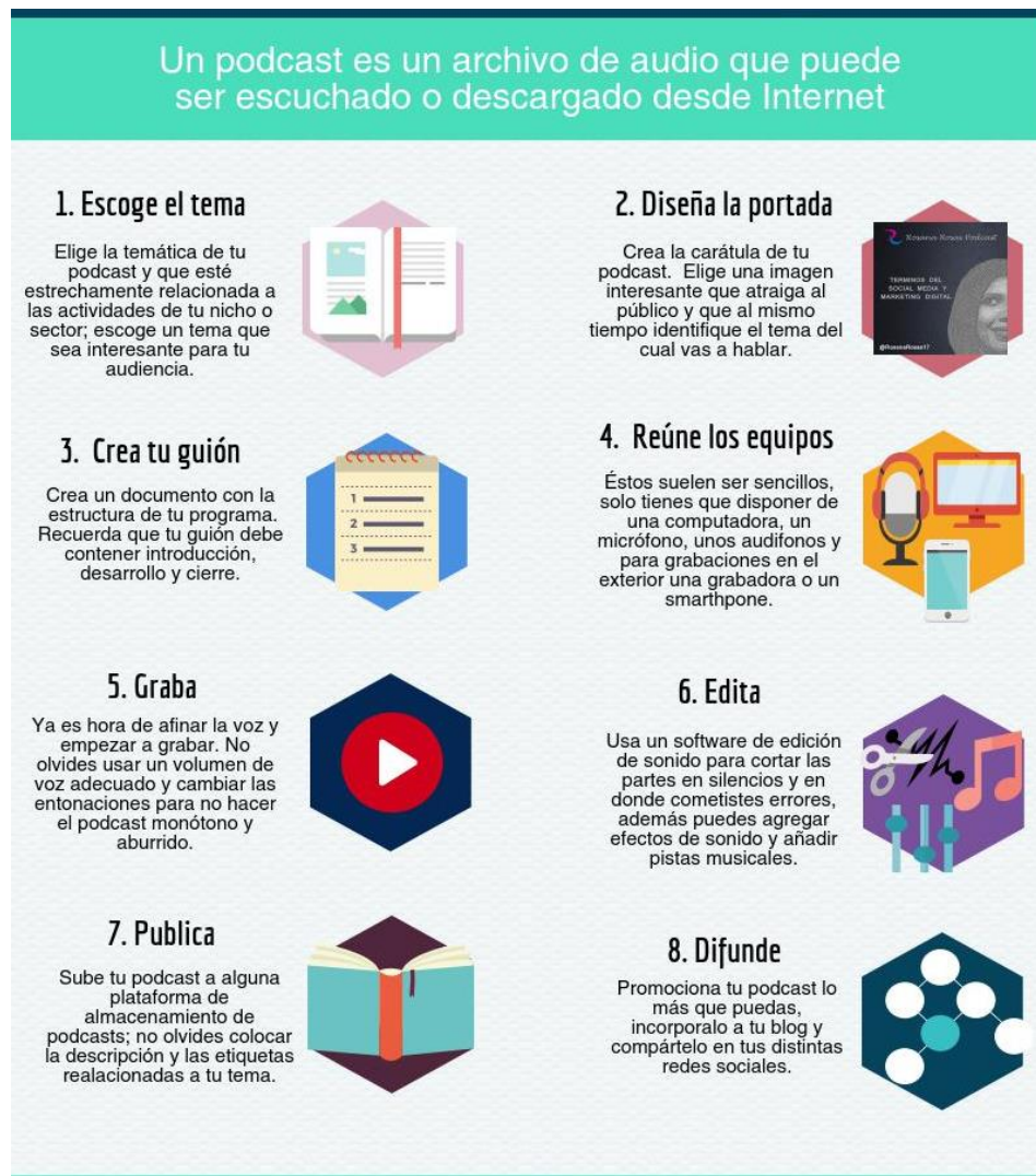
Ilustración con los pasos: