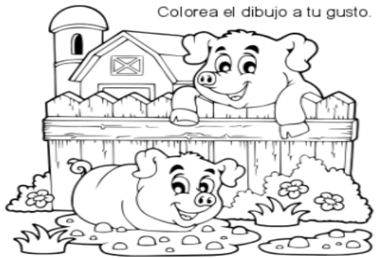
Colorea el dibujo a tu gusto.

Cynthia tiene ocho chocolates. Rubí tiene cinco chocolates. ¿Cuántos chocolates más tiene Cynthia que Rubí?