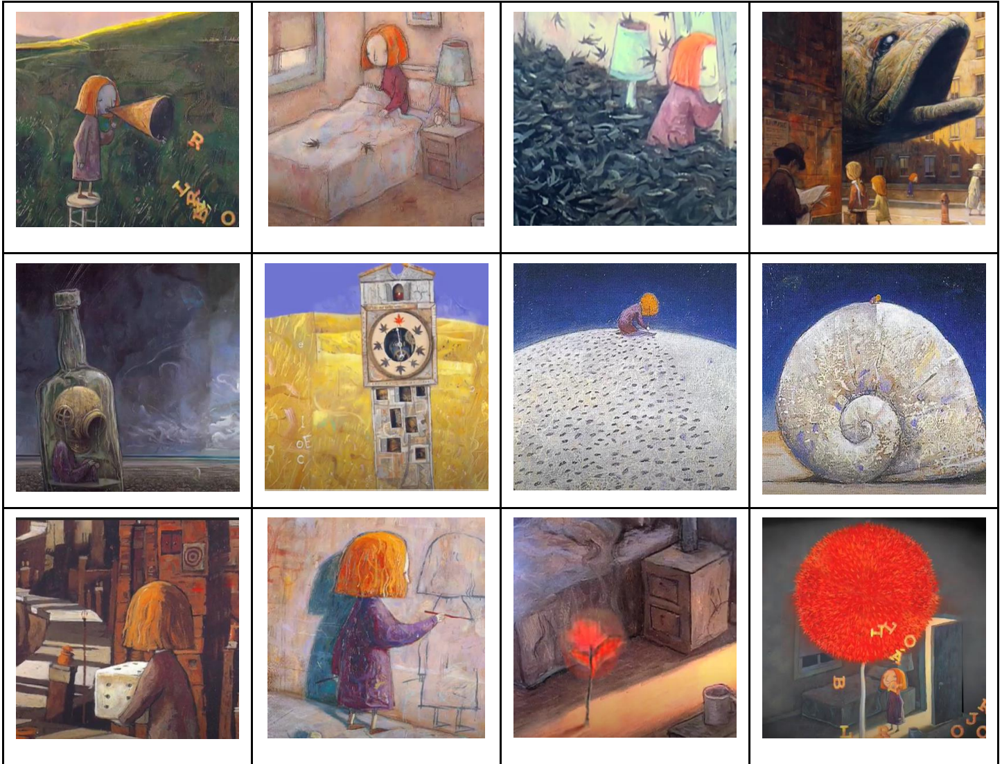
Ilustraciones El cuento el árbol Rojo