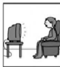
Ver televisión a una distancia moderada.