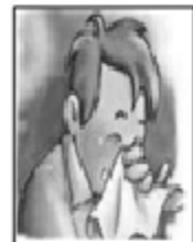
Limpiarse la nariz con un paño suave.