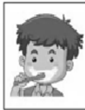
Cepillarse los dientes constantemente.