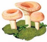
CORAL MILKY CAP