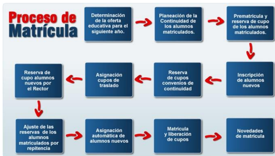
Figura No. 2 Proceso de Matrícula

El proceso de matrícula se muestra en la siguiente imagen: