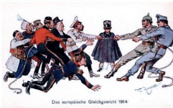
Das europäische Gleichgewicht 1914

(El equilibrio europeo en 1914 y la neutralidad italiana)