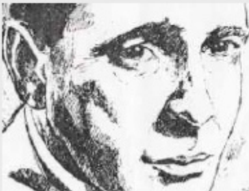
Primerísimo primer plano