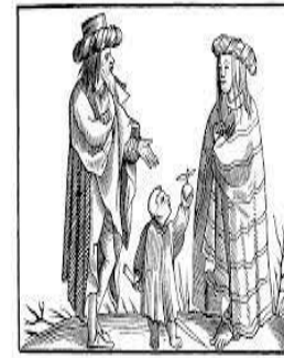
Fig. 111.—A Gypsy Family.—Fac-simile of a Woodcut in the "Cosmographie Universelle" of Mercur: in folio, Italia, 1552.