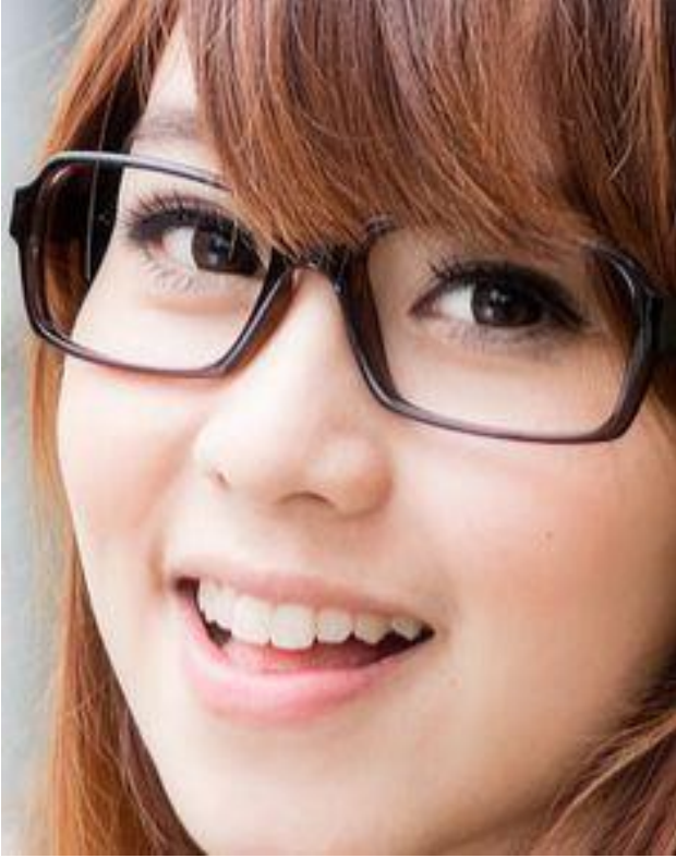
Primer primerísimo plano.

Actividad 4 Elaborar fotografías de autorretrato (siete) con los diferentes planos fotográficos en diferentes formatos y disponerlas de manera compositiva en la hoja de 50 cm x 35 cm rotulada de manera previa. Escribir el nombre de cada plano. Ejemplos: