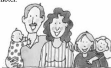
Ellos forman una familia.