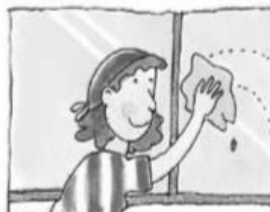
Doña Helena cuida de la casa y de sus hijas y trabaja en un hotel.