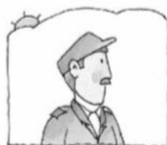
Don José trabaja desde temprano. Al regresar, ayuda en los oficios de la casa.