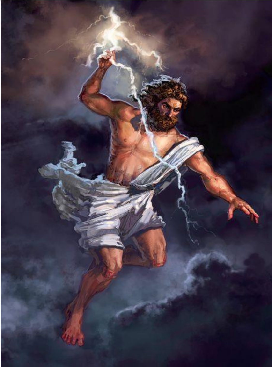
Imagen de Zeus, tomada de https://www.pinterest.de/pin/76772368627273904/ Nótese la relación de la imagen con la iconografía cristiana y la apología al cuerpo atlético.