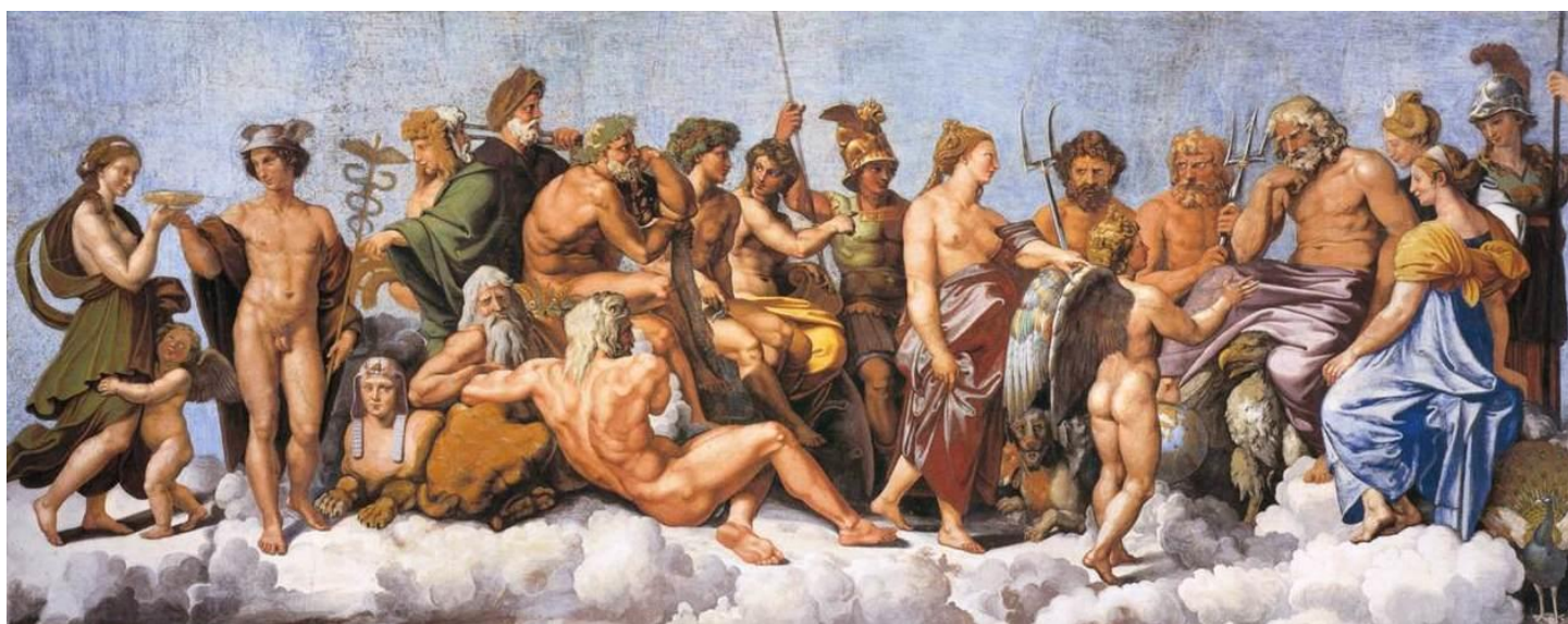
La asamblea de dioses recibe a Psique. (Loggia di Psiche) 1518-19, Rafael (Pintor renacentista)

El concepto de "doce dioses" es más antiguo que cualquiera de las primeras fuentes griegas. La palabra "Dios" ya era atribuida en aquel entonces a Zeus, mientras que "Theo" se refería a los restantes. Hubo, en varias épocas, catorce dioses diferentes reconocidos como olímpicos, aunque nunca más de doce a la vez. De este concepto es como se hace referencia a ellos como los doce olímpicos , también conocidos como Dodekathemon (en griego, dōdeka, "doce" theoi, "dioses").