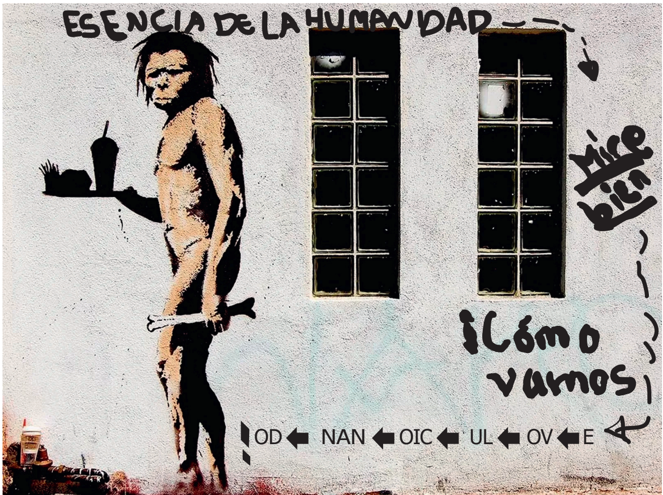
Graffiti anónimo escrito en la Universidad Nacional.