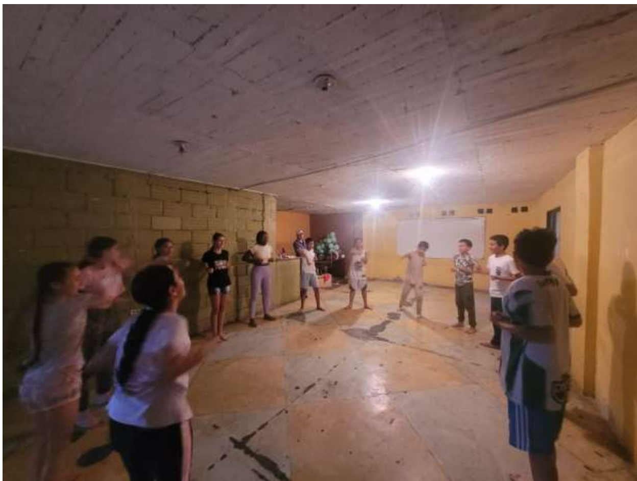
Semillero de baloncesto