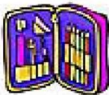
a pencil case