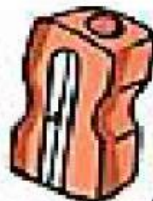
a pencil sharpener