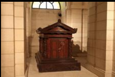
Tumba en "El panteón" de París

catecumenado en Turín, donde abandonó el calvinismo y fue bautizado como católico. Con Madame de Warens, trece años mayor que él, muy culta, que le ayudó en su educación y en su afición por la música, estableció una amistad materno-filial, que con el tiempo se transformó en amorosa y apasionada.