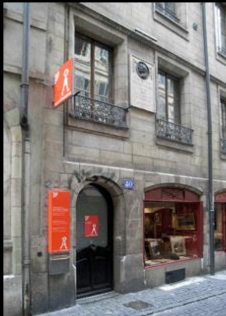
Casa natal de Rousseau en Ginebra