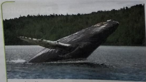
La ballena es un mamífero acuático que vive en el océano.