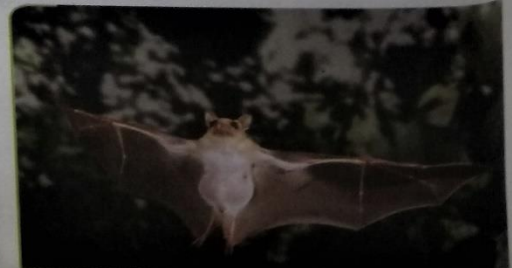
El murciélago es un mamífero volador que vive en cuevas.