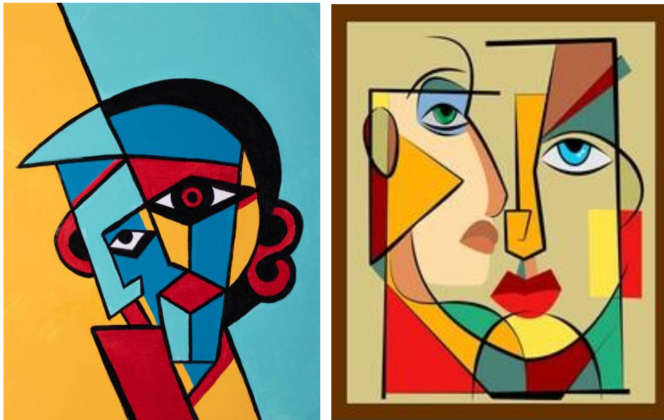
Pablo Picasso: Mujer con mandolina . 1910. Óleo sobre lienzo. 100.3 x 73.6 cm. Museo de Arte Moderno, Nueva York.

El cubismo representa la realidad mediante el empleo dominante de elementos geométricos, resultados del análisis y la síntesis. Los objetos no se representan como “son” o como se “ven”, sino como han sido concebidos por la mente, que los deconstruye en sus formas geométricas esenciales, orientando la atención al lenguaje plástico, la observación y el análisis. Comprendamos cómo lo hace.