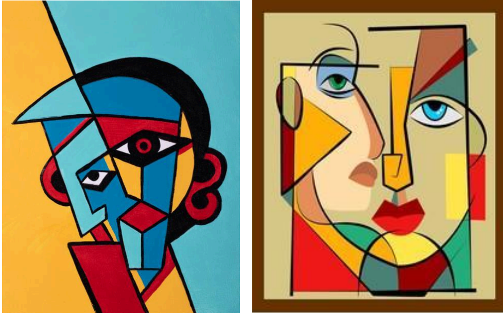
Pablo Picasso: Mujer con mandolina . 1910. Óleo sobre lienzo. 100.3 x 73.6 cm. Museo de Arte Moderno, Nueva York.

El cubismo representa la realidad mediante el empleo dominante de elementos geométricos, resultados del análisis y la síntesis. Los objetos no se representan como “son” o como se “ven”, sino como han sido concebidos por la mente, que los deconstruye en sus formas geométricas esenciales, orientando la atención al lenguaje plástico, la observación y el análisis. Comprendamos cómo lo hace.