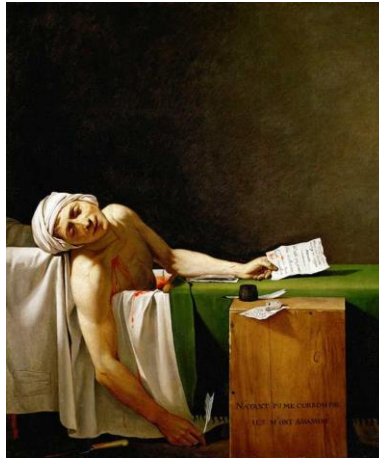
Jacques-Louis David: La muerte de Marat . 1793. Óleo sobre lienzo. 1,62 m x 1,28 m.