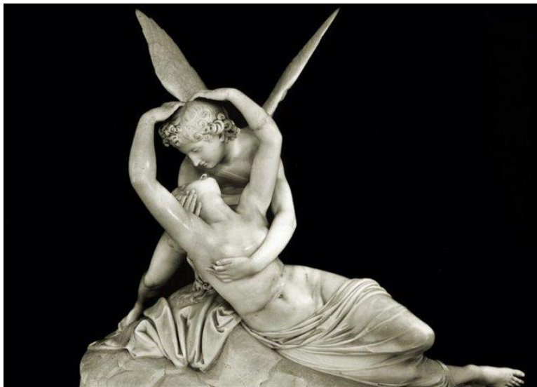
Antonio Canova: Eros y Psique . 1787-1793. Mármol. 155 cm x x 168 cm.