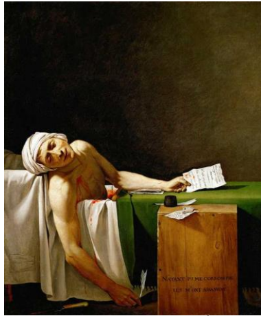
Jacques-Louis David: La muerte de Marat . 1793. Óleo sobre lienzo. 1,62 m x 1,28 m.