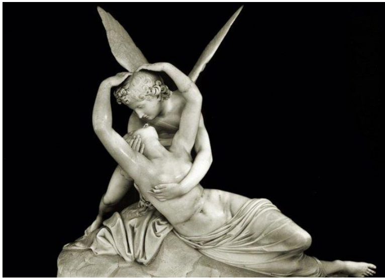
Antonio Canova: Eros y Psique . 1787-1793. Mármol. 155 cm x x 168 cm.