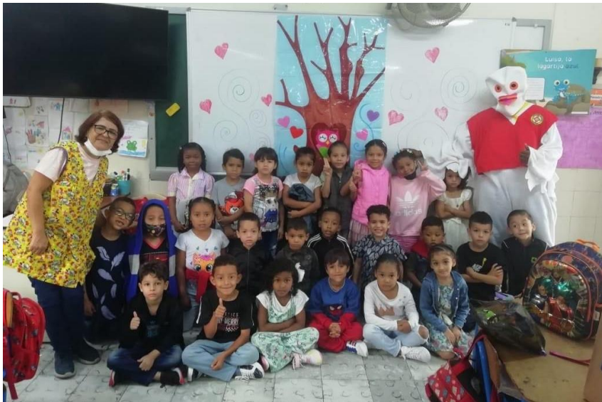
Presentación del Personaje Institucional: "Fundador" a los estudiantes de la Institución.