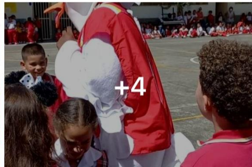
Participación del Personaje Institucional: "Fundador" en diferentes eventos Institucionales – Día del Idioma.