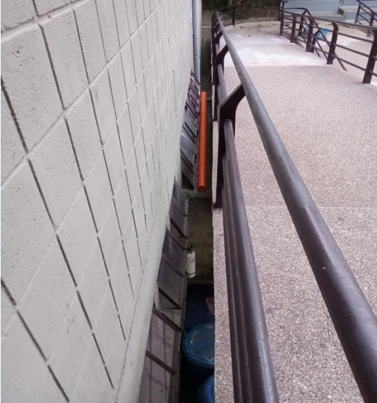
Espacio entre pasamanos y pared