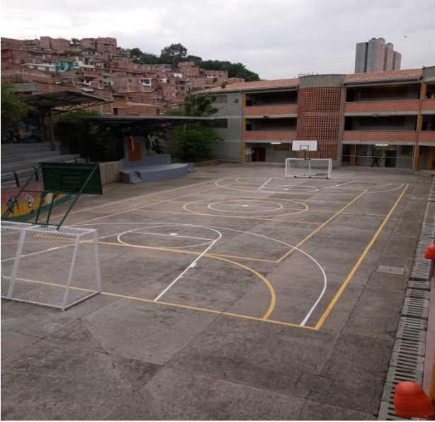
Espacio recreativo sede principal