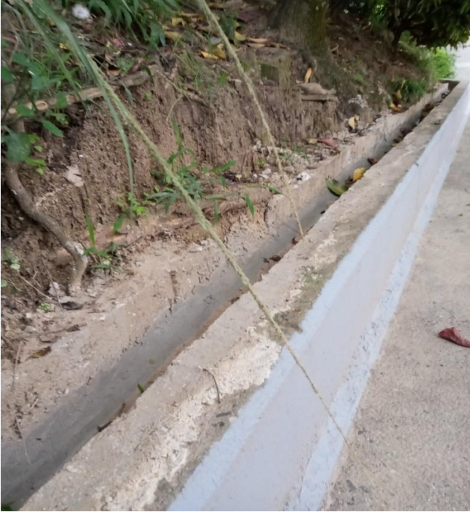
Canales de aguas lluvias en las tribunas