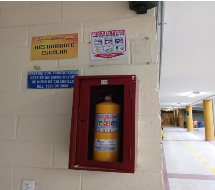
Recarga de extintores y cambio de señales