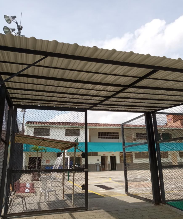
Cubierta entrada sede Socorro