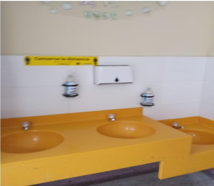
Lavamanos para alternancia