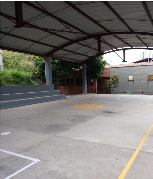
Cancha o coliseo