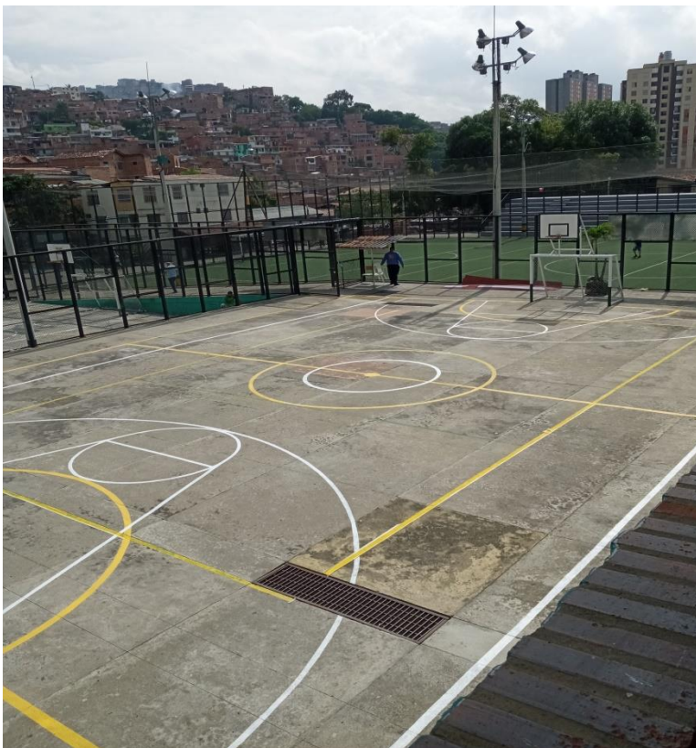
Cancha sede Socorro