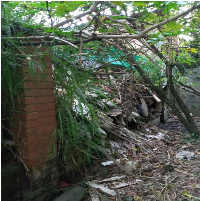
Muro perimetral caído