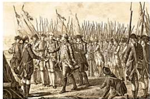
El general inglés Cornwallis firma la Capitulación de Yorktown.