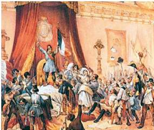
El asalto a las Tullerías, en París, el 10 de agosto de 1792.

Liderada por el dictador Maximilien de Robespierre , se decretó la ejecución de más de 50 mil personas acusadas de traición a la revolución. Estos excesos, ocasionaron la reacción de la Convención , que llevó a la ejecución de Robespierre y al establecimiento de una nueva constitución en 1795, en la que se crearon dos cámaras legislativas y el poder ejecutivo recayó en un Directorio .