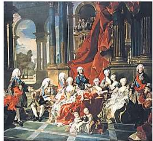
Cortesanos franceses del siglo XVIII.