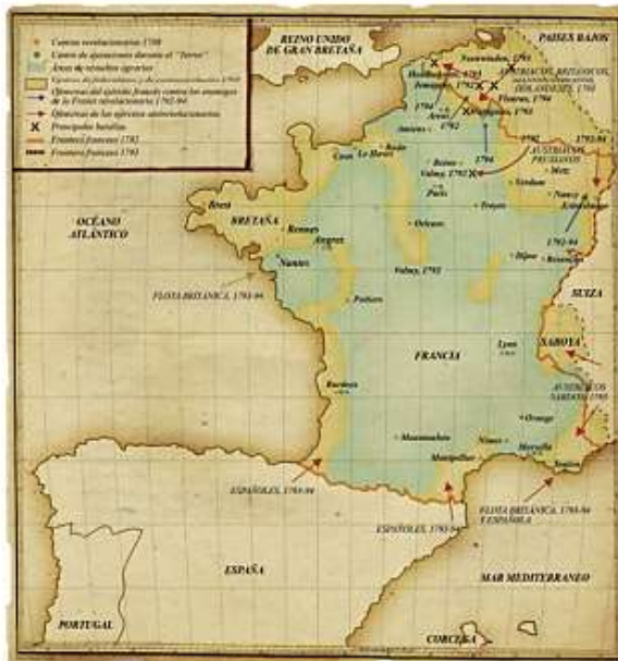
Francia y el desarrollo militar de la Revolución francesa, 1789-1795.