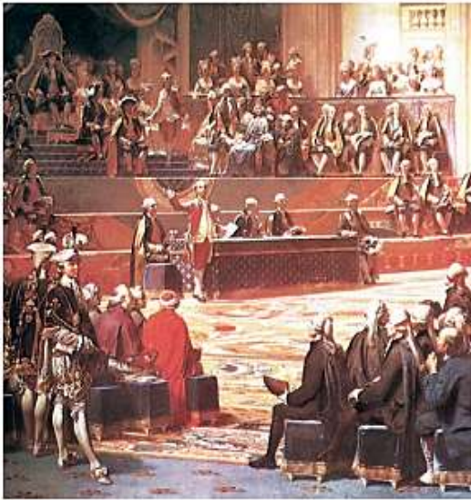
Sesión Inaugural de los Estados Generales, grabado de Jean-Michel Moreau, el Joven (1789).