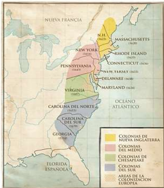
Mapa de las trece colonias británicas en América del norte.