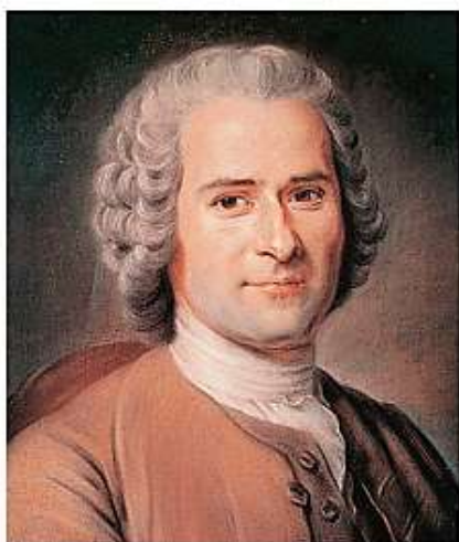
Juan Jacobo Rousseau.