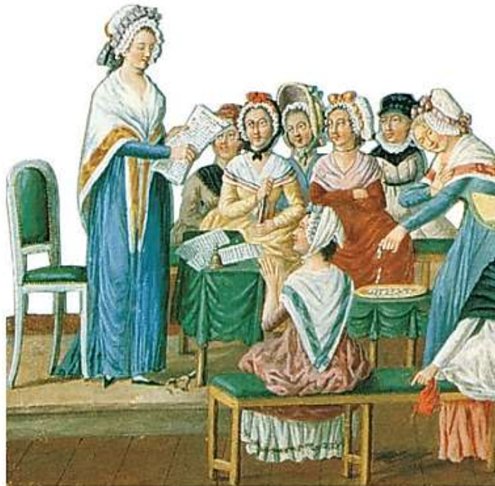
Club patriótico de mujeres.