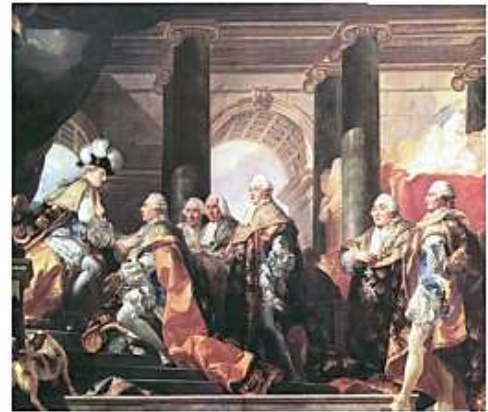
Luis XVI, rey de Francia.

Los monarcas de Francia eran tan detestados que en las plazas, a escondidas de la guardia real, los bufones imitaban a Luis XVI por carecer de dominio y a María Antonieta por gastar el dinero de Francia en perfumes y elegantes trajes.