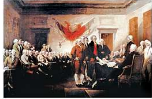
Declaración de la independencia de los Estados Unidos.