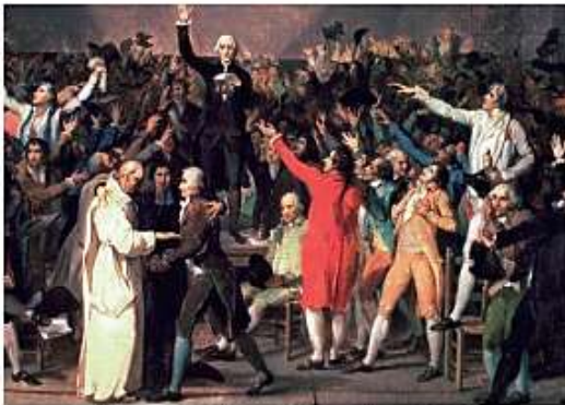
Juramento del Juego de la Pelota. 1789. Pintura de Louis David.

El 20 de junio, sus integrantes hicieron el Juramento del Juego de la Pelota . El acto se realizó en un salón del palacio en el que se practicaba este deporte, y por el cual se comprometieron a no separarse hasta aprobar la Constitución. El 9 de julio, esta asamblea se transformó en Asamblea Nacional Constituyente .