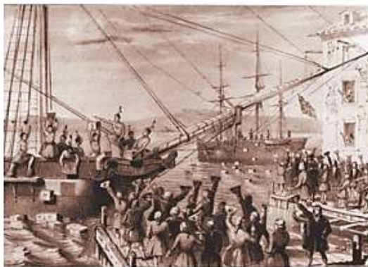
Litografía sobre el motín del té de 1783.

Colono: identifica a una persona que salió de su lugar de origen para establecerse en otro distante. Sin embargo, etimológicamente, colono significa persona que cultiva la tierra.