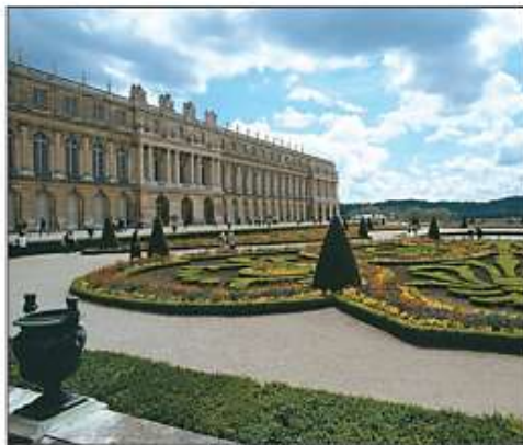
El palacio de Versalles. Sede de la monarquía francesa a finales del siglo XVIII.

La nobleza y el clero eran dueños de la mayoría de las tierras, controlaban el poder político y disfrutaban de privilegios como no pagar impuestos y tener leyes especiales. La mayoría de la población soportaba las cargas fiscales con las que se sostenía la estructura administrativa de los Estados y la minoría privilegiada.