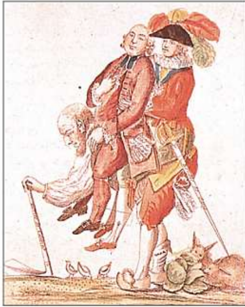
Campesino. llevando a cuestas a un noble y a un cura. 1789.