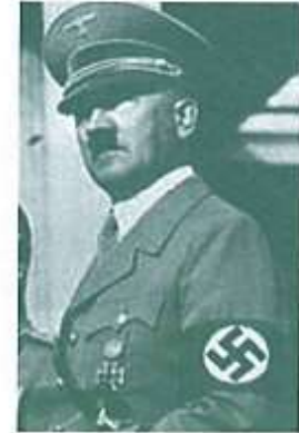
Adolfo Hitler, líder del Tercer Reich Alemán.