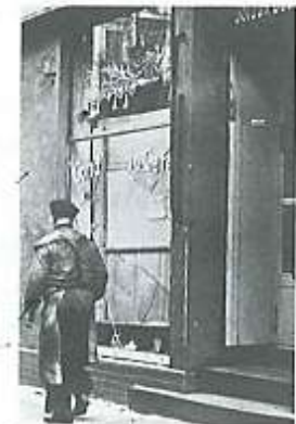
Tienda judía saqueada en 1938.