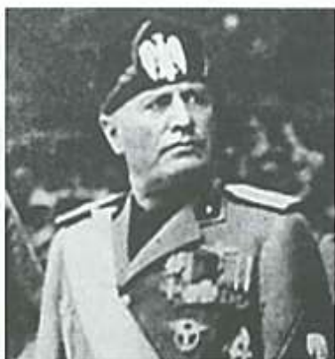
Benito Mussolini era conocido como El Duce o líder.