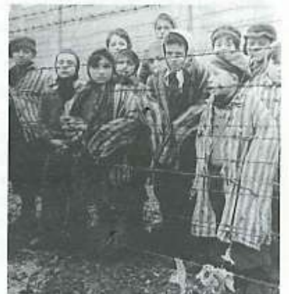
Prisioneros judíos en un campo de concentración nazi.