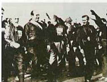
Mussolini acompañado por sus "camisas pardas", en la Marcha sobre Roma.