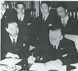
Firma del Pacto Antikomintern, el 25 de noviembre de 1936.

En 1931, Japón invadió Manchuria e instauró un protectorado, el Manchukuo . Un año después, ocupó la región al norte de la Gran Muralla y llegó hasta Shangai. La Sociedad de Naciones, incapaz de disuadir el militarismo japonés, expulsó a este país de la organización en 1933. Para 1937, Japón emprendió una segunda campaña militar contra China.