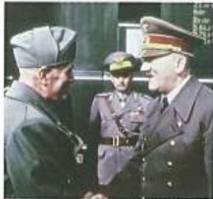
Adolfo Hitler y Benito Mussolini, artífices del expansionismo territorial de Alemania e Italia.