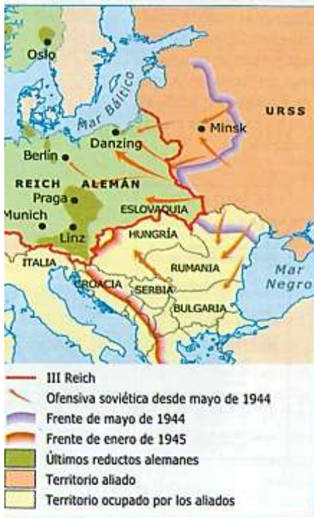
Los frentes oriental y del Pacífico.