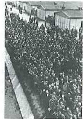
Campo de concentración de Dachau, construido en 1933.