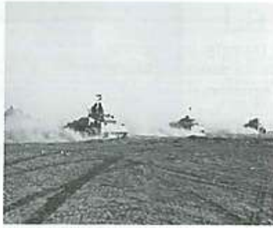
Batalla de El Alamein.