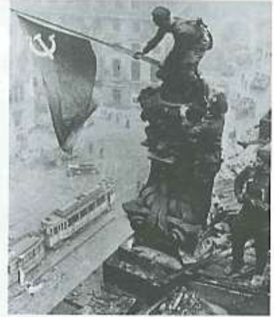
Soldados rusos izan la bandera de la Unión Soviética en el Reichstag durante la ocupación de Berlín.

Para la reorganización de la posguerra, los líderes de las potencias aliadas realizaron una serie de conferencias en Teherán en 1943, Yalta en febrero de 1945 y Postdam en julio de 1945. En ellas nació la política de bloques, al fijar las respectivas zonas de influencia de Estados Unidos y la Unión Soviética, el destino de Alemania y las nuevas fronteras europeas.