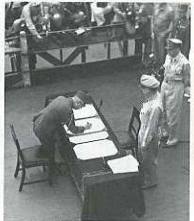
El emperador japonés Hirohito firma la rendición incondicional de su país en el acorazado norteamericano Missouri, 2 de septiembre de 1945.