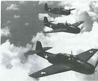
Batalla aérea de Midway.