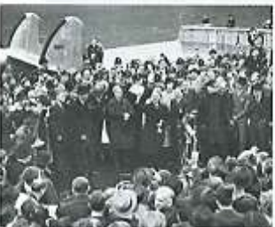
Los primeros ministros de Francia e Inglaterra, Daladier y Chamberlain, junto a Mussolini y Hitler, firman el Pacto de Múnich el 30 de septiembre de 1938.

En 1936, los gobiernos de Alemania, Italia y Japón estrecharon sus vínculos políticos por medio del entendimiento ideológico que buscaba acabar con el comunismo. En octubre, las relaciones entre Alemania e Italia se fortalecieron con la creación del Eje Roma-Berlín . Asimismo, en noviembre, Hitler firmó el Pacto Antikomintern con Japón, al cual luego se unió Italia.