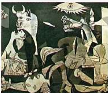
"Guernica" de Pablo Picasso, obra que representa el bombardeo alemán a esta ciudad española.