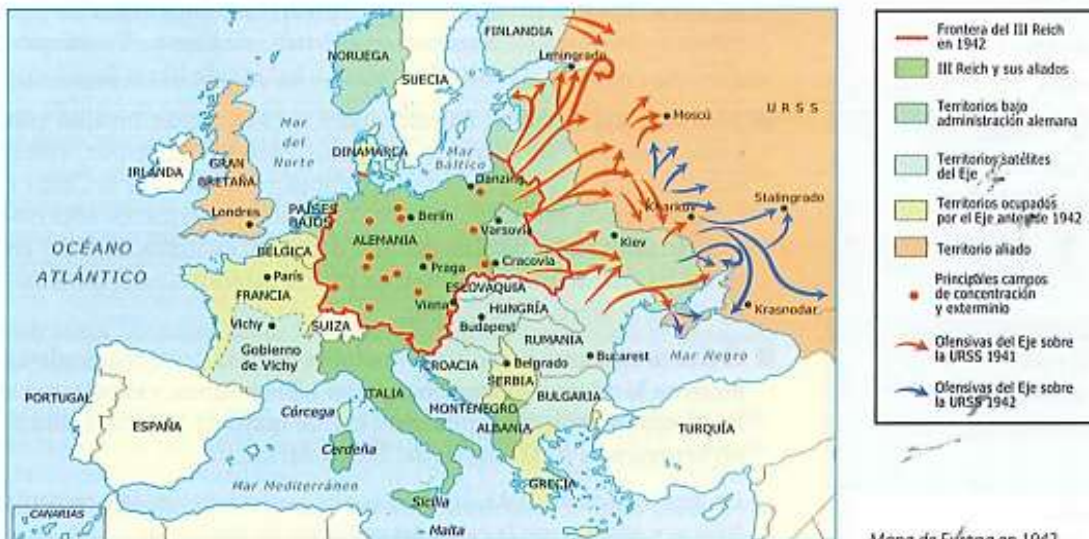
Mapa de Europa en 1942.

En octubre de 1940 Italia atacó Grecia, al tiempo que sufrió descalabros militares en África, donde los ingleses lograron penetrar en Libia y ocuparon Somalia, Eritrea y Etiopía. Estas derrotas obligaron a Hitler a enviar un cuerpo del ejército, conocido como los África Korps , para detener el avance británico. En abril de 1941, los alemanes cumplieron su objetivo y fijaron sus posiciones en Egipto. En esta misma fecha, las tropas alemanas derrotaron la resistencia aliada en Yugoslavia y Grecia, ocuparon Creta y fortalecieron su ocupación del norte de África en Libia. Las maniobras militares en África y los Balcanes, retrasaron las ambiciones territoriales alemanas en el oriente de Europa. En junio de 1941 los alemanes iniciaron la operación Barbarroja , que consistió en atacar a la URSS en una guerra relámpago. La resistencia del ejército rojo y el fuerte invierno detuvieron el avance alemán.