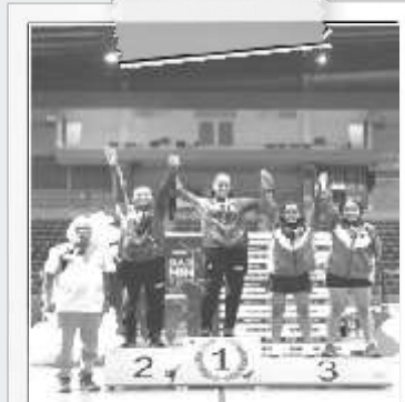
Salomé Uribe Piedrahita