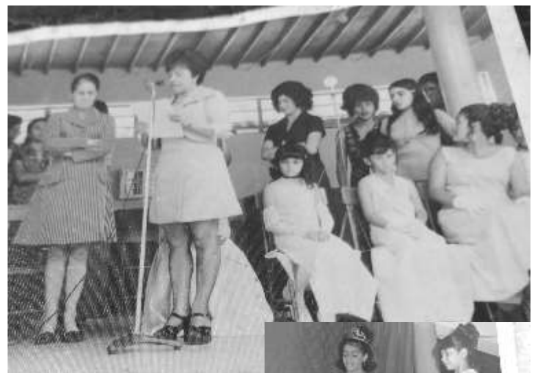
Evento reinado en la Escuela de Niñas El Pedregal, actos que enaltecen los valores y la alegría en la comunidad