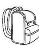
Morral School Bag (skul bag)