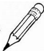
Lápiz Pencil (pensol)