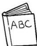
Libro Book (buk)