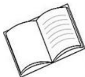
Cuaderno Notebook (notbak)