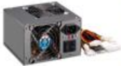
Fuente de Poder