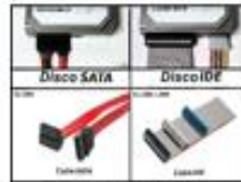
Cables IDE y SATA