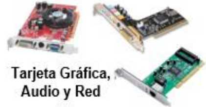
Tarjeta Gráfica, Audio y Red