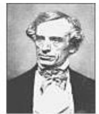
Samuel Morse

El siglo XIX fue el escenario en que las comunicaciones a distancia dieron un gran salto. En 1835 surge el Código Morse, que proporcionó la base para el desarrollo del Código Binario y dio paso para que en 1837 se desarrollara el telégrafo. Tan sólo unos años después, en 1876, se patentó un aparato que revolucionaría las tecnologías de comunicación: