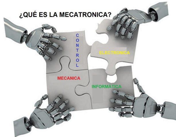
El Circulo de la Mecatrónica