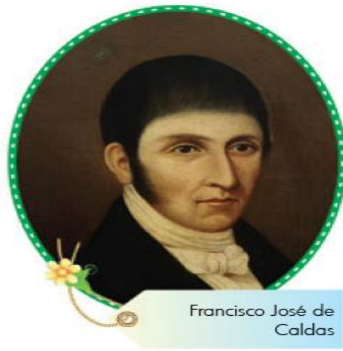
Francisco José de Caldas